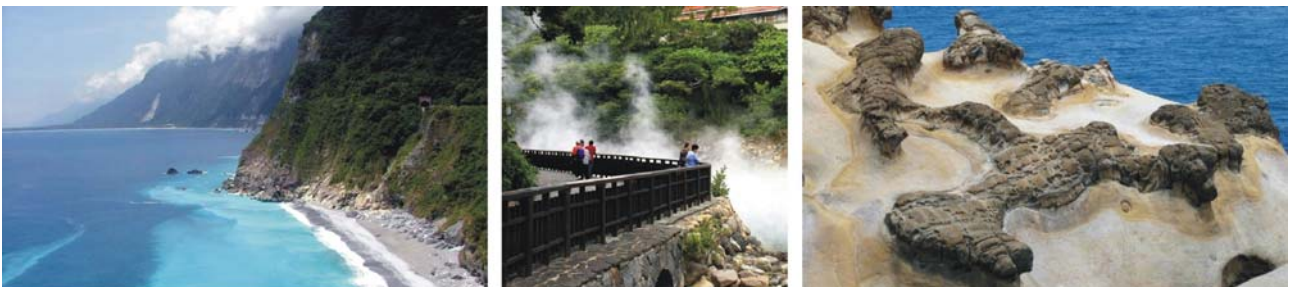
von links nach rechts: Pazifikküste zwischen Taitung und Hualien, Thermalquellen im Yangmingshan Nationalpark und bizarre Felsformationen von Yeliu

Unterkunft: Hualien Hero House **(*) (Hualien, 2 Übernachtungen)