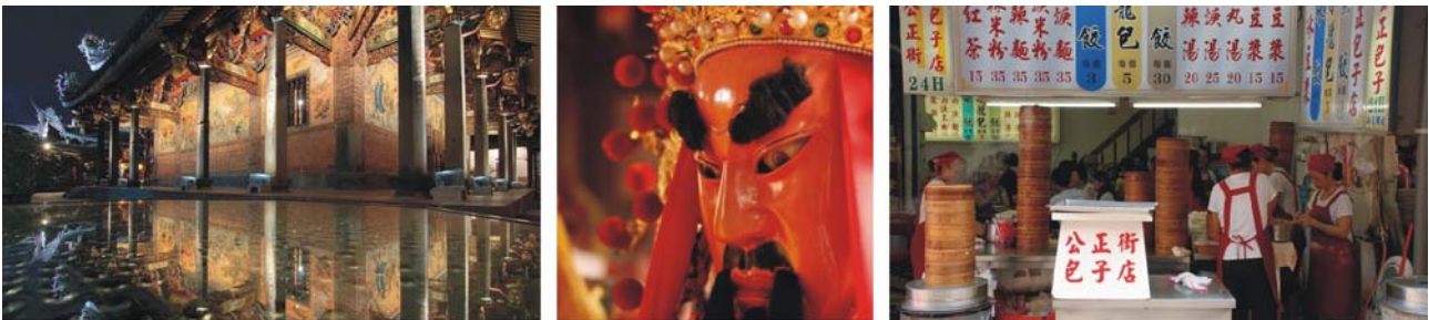
von links nach rechts: Baoan Tempel (Taipei), Daoistische Gottheit, Dim Sum-Restaurant

Unterkunft: Kenting Youth Activity Center*** (Kenting, 2 Übernachtungen)