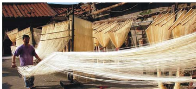
Lungshan Tempel in der Altstadt von Lukang und handgemachte Reissnudeln (hier die Trocknung an der Luft)