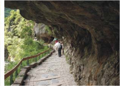
Nachtleben in der Kleinstadt Kenting, Shakatang-Trail über und entlang der Taroko-Schlucht (Taroko Nationalpark)

Sanhsientai: eine Bogenbrücke führt zu Korallenfelsen, die der Küste vorgelagert sind; das Gestein steht im krassen Gegensatz zu den vulkanischen Formationen des Küstengebirges, einem ehemaligen, durch die Plattentektonik mit Taiwan verbundenem Inselbogen.