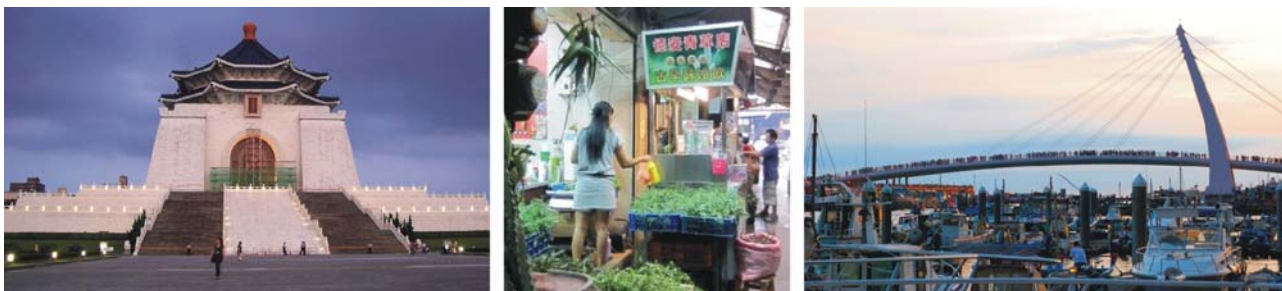
Taipei: Chiang Kai-shek Gedächtnishalle, Szene auf einem der zahlreichen Märkte, Fußgängerbrücke im Jachthafen von Danshui

Unterkunft: Chiantan Youth Activity Center*** (Taipei, 3 Übernachtungen)