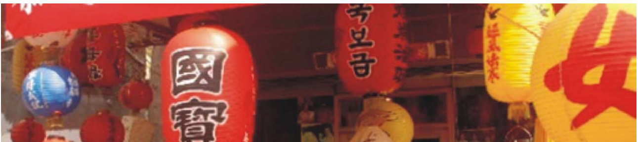
aus Papier und dünnen Bambus-Leisten hergestellte traditionelle Lampions

Nationales Palastmuseum: Nördlich der Innenstadt erhebt sich im chinesischen Stil der gigantische Gebäudekomplex des Museums, dem im gesamten chinesischen Kulturkreis eine Bedeutung zukommt, die der des Louvre für Europa gleichgestellt werden kann. Bereits die Kaiser der Sung-Dynastie (10.-13. Jh.) begannen mit der Sammlung, indem im gesamten Reich alles von Interesse durch ihre Beamten an den kaiserlichen Hof bringen ließen. Über die Yuan- und Ming-Dynastie bis zur Ching-Dynastie entwickelte sich so die kaiserliche Schatzkammer in der verbotenen Stadt Pekings zu einer der größten Sammlungen weltweit. Durch den Sturz des letzten Kaisers 1911 gelangten die gesamten Schätze in den Besitz der Republik China, die 1925 die Tore der verbotenen Stadt für die Allgemeinheit öffnete. Während des Krieges mit Japan wurde die gesamte Sammlung nach Nanking in Sicherheit gebracht, 1949 auf dem Rückzug vor den Kommunisten nach Taipei verfrachtet, wo 1965 das eigens hierfür gebaute Museum eröffnet wurde. Von den rund 700.000 Einzelstücken werden 15.000 im Museum gezeigt, um dann alle 3 Monate komplett ausgewechselt zu werden.