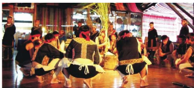
Gebirgsbahn zum Alishan im zentralen Bergland und Bunun-Ureinwohner