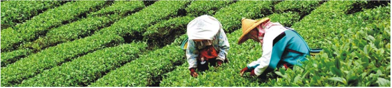
Pflückerinnen auf einer Tee-Plantage im zentralen Bergland

Linantai: Das Gebäude im Qing-Stil ist eines der besterhaltenen Beispiele für ein Wohnhaus der chinesischen Oberschicht. Neben der großzügigen Gartenanlage verdeutlichen die um 1740 entstandenen Wohnräume, dass beim Bauen vor allem das Fengshui - die Lehre von den unsichtbaren Kräften, die über Glück und Unglück des Hauses entscheiden - eine wichtigere Rolle gespielt hat, als baumeisterliche Aspekte.