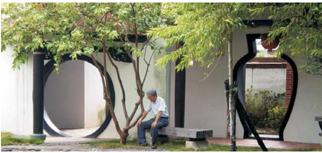
Lin An Tai: Garten-Architektur der Qing-Dynastie aus dem 18. Jh. in Taipei