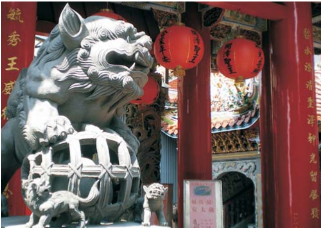
daoistischer Bishan-Tempel im Südosten von Taipei