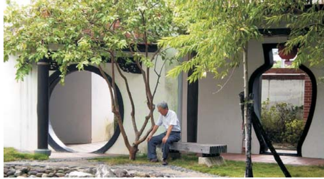
Lin An Tai: Garten-Architektur der Qing-Dynastie aus dem 18. Jh. in Taipei

Nach seiner enormen wirtschaftlichen Entwicklung, gehört Taiwan heute zu den Ländern mit dem höchsten Wohlstand. Der hohe Lebensstandard spiegelt sich in zahlreichen Bereichen wider: angefangen bei der hervorragenden Infrastruktur, über das Gesundheitswesen, bis hin zur vorbildlichen Bildungspolitik. Der unglaubliche Reichtum an chinesischen Kulturgütern und die teils atemberaubenden Landschaften dieser großen Insel lohnen auf jeden Fall die weite Anreise, die wir mit China Airlines im Direktflug ansteuern. Von den Portugiesen zu recht Ilha Formosa (die schöne Insel) genannt, lockt Taiwan bis heute mit einer einzigartigen subtropischen Vegetation. Der größte Teil der Insel wird durch Bergmassive mit fast 4000 m Höhe geprägt. Heiße Quellen deuten auf eine recht junge Entstehung - das Gebirge zählt zu den jüngsten weltweit.