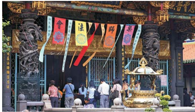
Gebet im Longshan-Tempel (Taipei)

Nach seiner enormen wirtschaftlichen Entwicklung, gehört Taiwan heute zu den Ländern mit dem höchsten Wohlstand. Der hohe Lebensstandard spiegelt sich in zahlreichen Bereichen wider: angefangen bei der hervorragenden Infrastruktur, über das Gesundheitswesen, bis hin zur vorbildlichen Bildungspolitik. Der unglaubliche Reichtum an chinesischen Kulturgütern und die teils atemberaubenden Landschaften dieser großen Insel lohnen auf jeden Fall die weite Anreise, die wir mit China Airlines im Direktflug ansteuern. Von den Portugiesen zu recht Ilha Formosa (die schöne Insel) genannt, lockt Taiwan bis heute mit einer einzigartigen subtropischen Vegetation. Der größte Teil der Insel wird durch Bergmassive mit fast 4000 m Höhe geprägt.