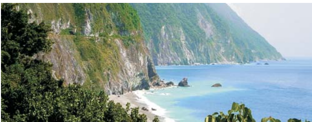
Quingshui Cliff an der Pazifik-Küste

Nach der Anmeldung zu dieser Exkursion über GEOPULS wird mit der von GEOPULS zugesandten Buchungsbestätigung eine Anzahlung (15 % des Reisepreises) fällig. Die Restzahlung erfolgt zwei Wochen vor Reisebeginn. Es gelten die Geschäftsbedingungen des Veranstalters: Geopuls GbR, Dr. Rolf Beck & Dr. Harald Borger, Neckarhalde 62, 72108 Rottenburg (Tel. 07472-9808802). Die Allgemeinen Reisebedingungen können bei uns angefordert oder auch unter www.geopuls.de eingesehen werden.