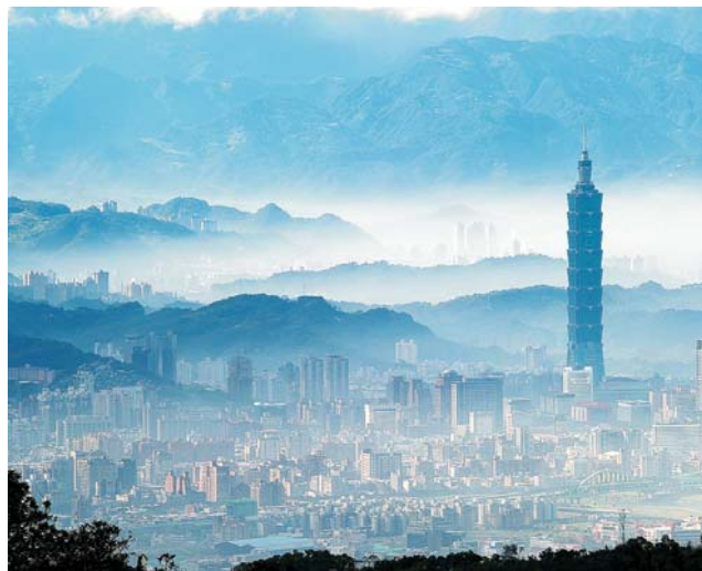
Taipei im Morgendunst mit dem 101 Tower, einst höchstes Gebäude der Welt

dieser Folder wurde CO 2 -neutral hergestellt