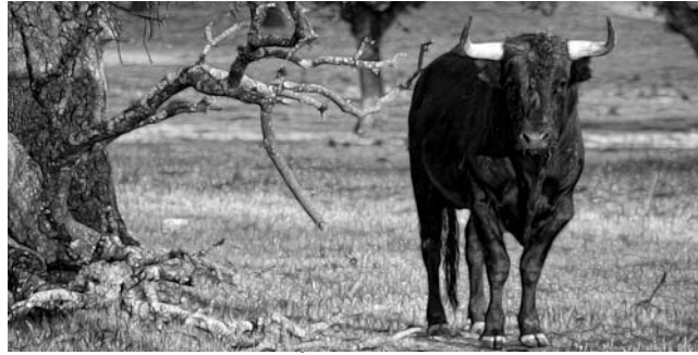
Szene in einem Korkeichenhain in der Extremadura