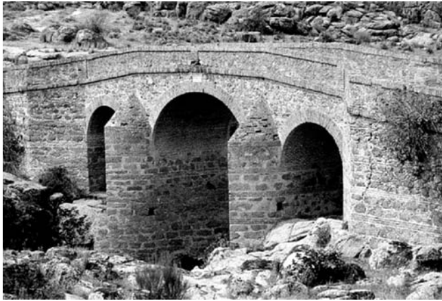
Alte Brücke über dem Rio Pusa in der La Jara