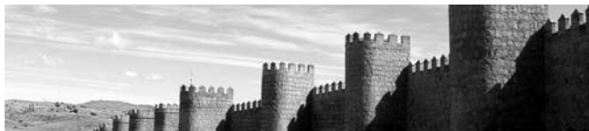
die Mauern von Avila

Nach der Anmeldung zu dieser Exkursion wird mit der von GEOPULS zugesandten Buchungsbestätigung eine Anzahlung (15 % des Reisepreises) fällig. Die Restzahlung erfolgt zwei Wochen vor Reisebeginn. Es gelten die Geschäftsbedingungen des Veranstalters: Geopuls-Studienreisen, Neckarhalde 62, 72108 Rottenburg a.N. (Tel. 07472-9808802). Die Allgemeinen Reisebedingungen werden gerne vorab zugeschickt. Sie können bei der VHS eingesehen, oder auch von der Homepage www.geopuls.de ausgedruckt werden.