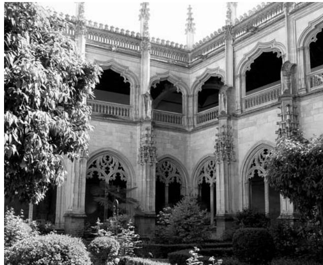
Kreuzgang aus dem 16. Jh. im Kloster von Guadalupe (UNESCO Weltkulturerbe)