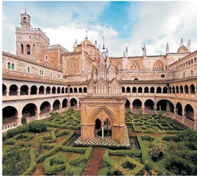
Kreuzgang des Klosters Nuestra Señora de Guadalupe (UNESCO Weltkulturerbe)

dieser Folder wurde CO 2 -neutral hergestellt