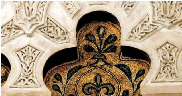
Detail Vielpassbogen im Mihrab der Mezquita, Córdoba

Nach der Anmeldung zu dieser Studienreise wird mit der von GEOPULS zugesandten Buchungsbestätigung eine Anzahlung (15 % des Reisepreises) fällig. Die Restzahlung erfolgt zwei Wochen vor Reisebeginn. Es gelten die Geschäftsbedingungen des Veranstalters: Geopuls-Studienreisen, Neckarhalde 62, 72108 Rottenburg a.N. (Tel. 07472-9808802). Die Allgemeinen Reisebedingungen werden gerne vorab zugeschickt. Sie können bei der VHS eingesehen, oder auch von der Homepage www.geopuls.de ausgedruckt werden.