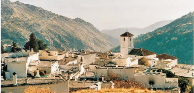
Das urige Bergdorf Capileira, in dem wir zwei Tage Station machen

Komplettpreis pro Person im DZ: 2120 €, EZ +420 € max. Teilnehmerzahl: 16 Personen