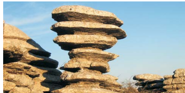
im Karstgebiet des El Torcal bei Antequera

GEOPULS als Veranstalter für alle am Reisen interessierten Menschen wurde 2004 von Dozenten des Geographischen Instituts in Tübingen gegründet und arbeitet seitdem mit der vhs zusammen. Begeisterte Geographen und Landeskundler, die Natur, Kultur und Hintergründe eines Ziellandes bestens vermitteln können, führen Sie bei diesen Exkursionen. Wir versuchen dabei, ein Land möglichst umfassend zu bereisen, was bedeutet, dass neben den berühmten Sehenswürdigkeiten auch die Landesnatur Beachtung und Erklärung findet. Kleine Wanderungen und Spaziergänge in die Natur bieten deshalb immer wieder eine schöne und interessante Abwechslung zum Kulturprogramm. Nicht zuletzt gilt es dabei auch, die so oft übersehenen kleinen Dinge zu entdecken. Dies funktioniert am besten in einer überschaubaren Gruppe, weshalb die Teilnehmerzahl auf 16 Personen begrenzt ist.