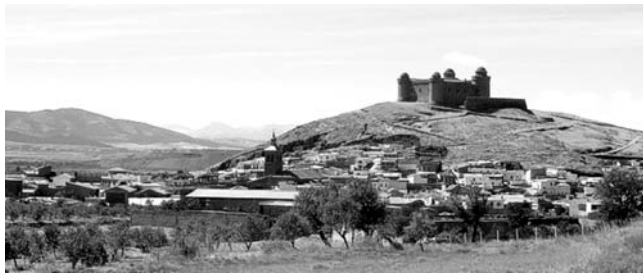
Die Burg La Calahorra am Fuß der Sierra Nevada