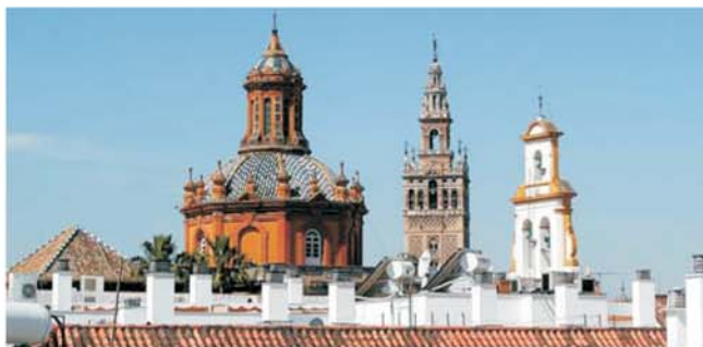
über den Dächern der Altstadt von Sevilla

dieser Folder wurde CO 2 -neutral hergestellt