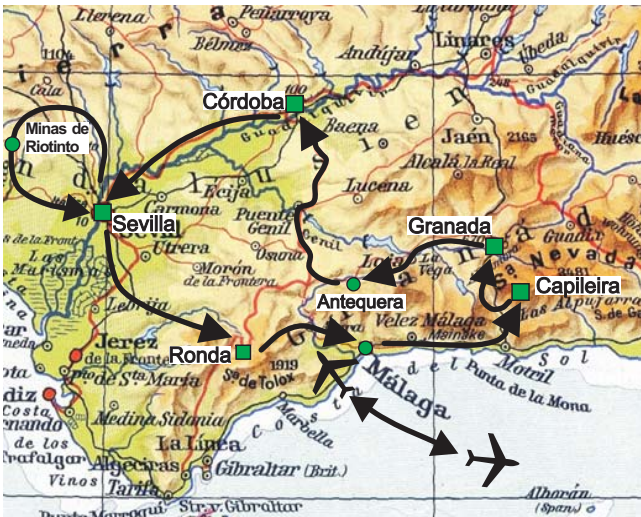
Geopuls-Exkursionsroute Andalusien ■ Übernachtungsorte