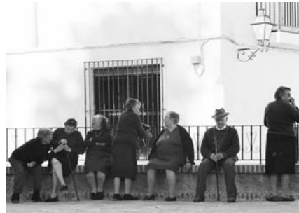
Alltagszene in einem Bergdorf der Alpujarra Alta

Wer mit offenen Augen durch Andalusien reist, merkt bald, dass die gefühlvolle Beschreibung Granadas durch den unbekannteren Poeten noch an vielen anderen Orten dieser südlichsten Region Spaniens seine Berechtigung hat. Nirgendwo währte die orientalisch-arabische Präsenz auf europäischem Boden länger und intensiver als hier - fast 800 Jahre lang. Zurück blieben Monumente, die man ohne Übertreibung glanzvoll, großartig und einmalig nennen darf, und die dabei noch die seltene Eigenart besitzen die Seele zu berühren. Granada, Cordoba und Sevilla sind aber nur die prominentesten Orte, die auf dieser Reise intensiv und nicht im Schnelldurchlauf zu erleben sind. Genauso viel Aufmerksamkeit schenken wir als Geographen der Vielfalt an außergewöhnlichen Naturlandschaften. Einige naturkundliche Ausflüge, kleine Wanderungen und Stopps, führen uns immer wieder zu den Sehenswürdigkeiten der Natur. Die Gebirgslandschaften der Sierra Nevada und der Alpujarra Alta mit den berühmten weißen Dörfern und Relikten einstiger maurischer Besiedlung stehen ebenso auf dem Programm wie die ausgedehnte Delta-Landschaft des Río Guadalquivir im Nationalpark Coto de Doñana südwestlich von Sevilla. Ein weiterer Höhepunkt wird die bizarre Karstlandschaft im Naturreservat des El Torcal bei Antequera sein. Um das Flair Andalusiens so authentisch wie möglich erleben zu können, wohnen wir stets in kleinen Hotels inmitten der historischen Altstädte.