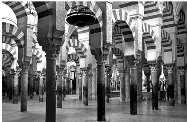
In der Mezquita von Cordoba. Moschee und Kathedrale zugleich.