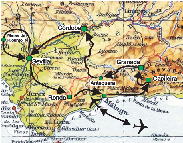
Geopuls-Exkursionsroute Andalusien ■ Übernachtungsorte