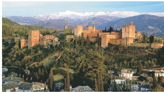
die Alhambra von Granada, im Hintergrund die im Frühjahr oft noch schneebedeckten Berge der Sierra Nevada

dieser Folder wurde CO 2 -neutral hergestellt