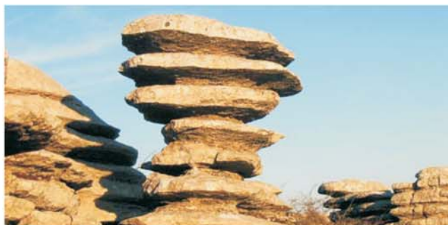
im Karstgebiet des El Torcal bei Antequera

GEOPULS als Reiseveranstalter wurde 2004 von Dozenten des Geographischen Instituts in Tübingen gegründet. Durch die Zusammenarbeit mit der VHS bietet sich Ihnen die Gelegenheit, mit uns ein Land intensiv, möglichst authentisch und geographisch ganzheitlich zu erleben. Nicht Reiseleiter von Beruf, sondern begeisterte Geographen und Landeskundler, die sich durch eigene Arbeiten und Erfahrungen im jeweiligen Land bestens auskennen, bilden die Mannschaft von Geopuls. Das Kennenlernen von Kultur und Menschen ist nur die eine Hälfte einer Reise mit Geopuls. Ebensoviele Aufmerksamkeit schenken wir stets der Landesnatur. Ausflüge und kleine Wanderungen in die Natur gehören immer dazu, um die Besonderheiten von Landschaft, Vegetation, etc. verstehen und hautnah erleben zu können. Die Gruppengröße ist mit maximal 16 Teilnehmern bewusst überschaubar.