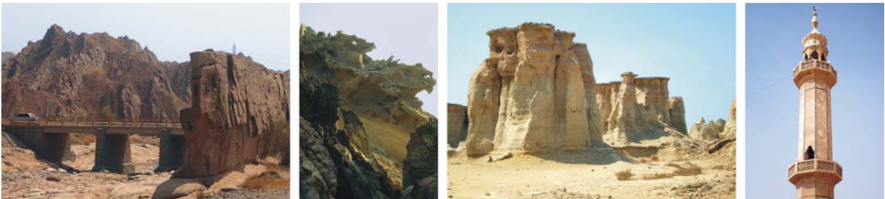
von links nach rechts: Erosionslandschaft bei Minab, Felsformationen auf Hormuz und auf Qeshm, sunnitische Minarett in einem Wüstendorf bei Armak

(Übernachtungen: 2 x in Bandar Abbas, 1 x Bandar Lengeh)