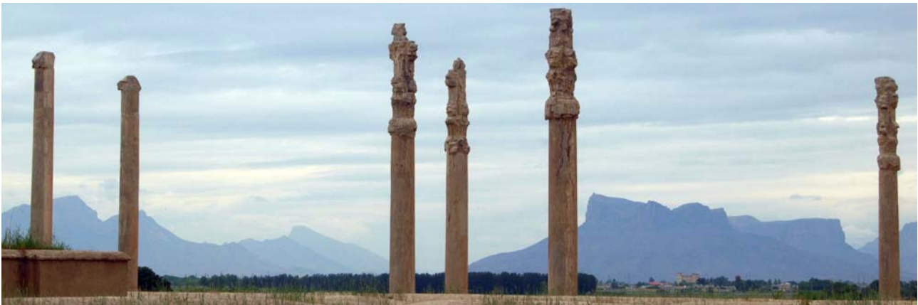
Persepolis in der Dämmerung am Abend

Preis pro Person im DZ: 290,- € (EZ- Zuschlag: 90,- €); Mindestteilnehmerzahl 2 Personen