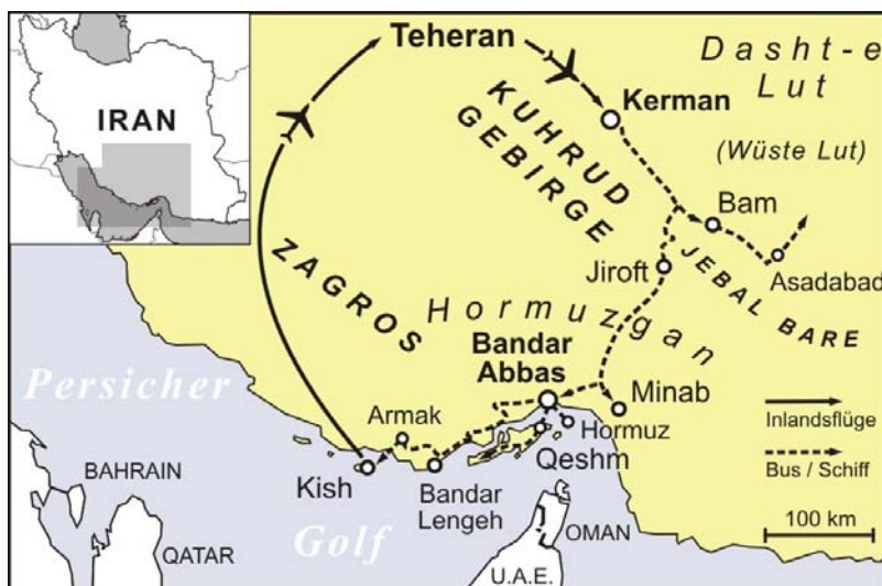
Reiseziele und Route im Überblick