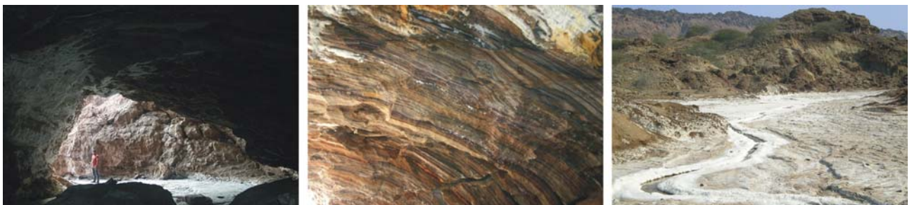
von links nach rechts: Eingang der Höhle im Namakdan-Salzgletscher, Salzsichten in der Höhle, Salzfluss auf Hormuz am Fuße des Salzdiapirs

Bandar Abbas: Die Hauptstadt der Provinz Hormuzgan ist zugleich einer der wichtigsten Häfen an der iranischen Golfküste, der zur Ausweitung des Fernhandels bereits zu Beginn des 17. Jh. unter Shah Abbas ausgebaut wurde. Bis in der zweiten Hälfte des 20. Jh. lag die Bedeutung von Bandar Abbas (1956 erst 18.000 Einwohner) jedoch noch weit hinter der von Busher. Danach wurde die Stadt jedoch zu einem modernen Hafen für die Erzvorkommen Südirans (Kupfer aus Kerman, Chrom aus Minab, Hämatit von Hormuz) und als Marinestützpunkt ausgebaut. Heute präsentiert sich die Stadt mit rund 300.000 Einwohnern als moderne Metropole des Südens. An historischen Sehenswürdigkeiten hat die Stadt zwar nur wenig zu bieten, der moderne Flair lädt dennoch zu abendlichen Spaziergängen, z.B. entlang der Strandpromenade. Der Bazar ist, ähnlich wie in Minab, v.a. wegen seinem Lokalkolorit interessant, daneben der große Fischmarkt mit seinem bunten Treiben. Ein ehemals hinduistischer Tempel, heute Museum, zeugt vom einstigen Handel mit Indien. Unweit davon steht die moderne Jame-Moschee für den schiitischen Iran.