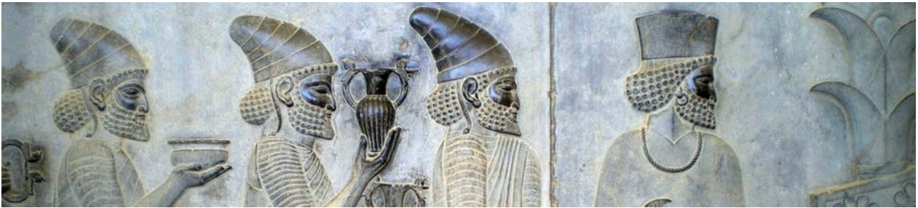
Reliefdetail in Persepolis

14. Tag: Rückflug nach Köln in den frühen Morgenstunden (Ankunft in Köln gegen Mittag) und Rückfahrt zum Heimatort mit dem Zug (das Rail&Fly-Ticket, sofern von Ihnen bereits zur Reise gewünscht, wird natürlich im Falle der Verlängerung an diesem Tag gültig sein). Bitte beachten Sie , dass Sie im Falle der Verlängerung nicht nach Frankfurt, sondern nach Köln zurück fliegen werden.