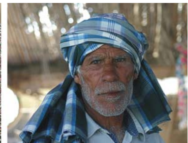
von links nach rechts: junge Iranerin, arabischstämmige Frauen mit Gesichtsmasken, Fischer in der Provinz Hormuzgan