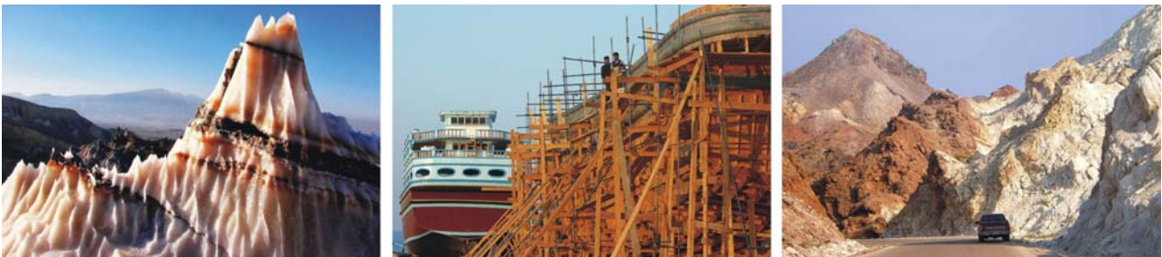
von links nach rechts: Karsterscheinungen im Salz, Dau-Werft bei Bandar Lengeh, Eisenoxyd (rot) und Gips (weiß) am Salzdiapir (hinten) von Hormuz