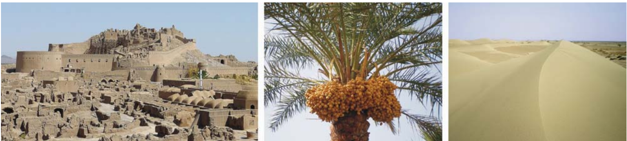
von links nach rechts: Bam im Oktober 2013, Dattelpalme mit Früchten, Dünen im Südwesten der Wüste Lut

(Übernachtungen: 2 x in Bam, 1 x in Minab)