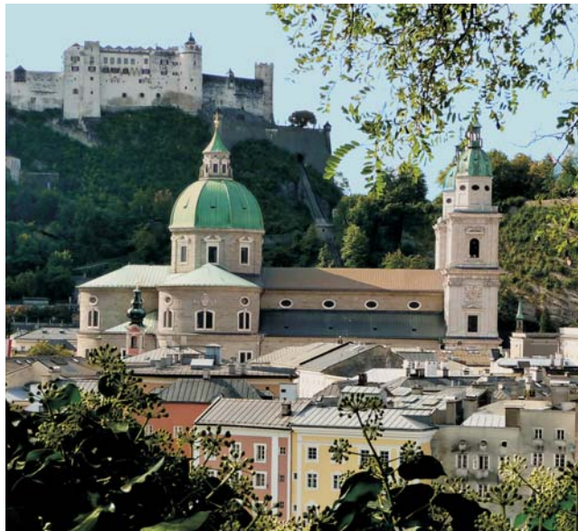
Blick vom Kapuzinerberg auf den Dom und die Festung von Salzburg

dieser Folder wurde CO 2 - neutral hergestellt