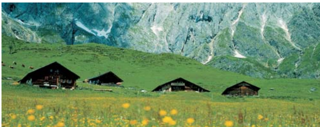
Blühende Almwiesen am Fuß des Hochkönig

Nach der Anmeldung zu dieser Studienreise wird mit der von GEOPULS zugesandten Buchungsbestätigung eine Anzahlung (15 % des Reisepreises) fällig. Die Restzahlung erfolgt zwei Wochen vor Reisebeginn. Es gelten die Geschäftsbedingungen des Veranstalters: Geopuls-Studienreisen, Neckarhalde 62, 72108 Rottenburg a.N. (Tel. 07472-9808802). Die Allgemeinen Reisebedingungen werden gerne vorab zugeschickt. Sie können bei der VHS eingesehen, oder auch von der Homepage www.geopuls.de ausgedruckt werden.