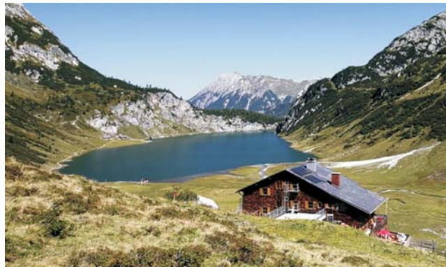
Der Tappenkarsee mit der idyllisch gelegenen Tappenkarsee Hütte

Nach der Anmeldung zu dieser Studienreise wird mit der von GEOPULS zugesandten Buchungsbestätigung eine Anzahlung (15 % des Reisepreises) fällig. Die Restzahlung erfolgt zwei Wochen vor Reisebeginn. Es gelten die Geschäftsbedingungen des Veranstalters: Geopuls-Studienreisen, Neckarhalde 62, 72108 Rottenburg a.N. (Tel. 07472-9808802). Die Allgemeinen Reisebedingungen werden gerne vorab zugeschickt. Sie können bei der VHS eingesehen, oder auch von der Homepage www.geopuls.de ausgedruckt werden.