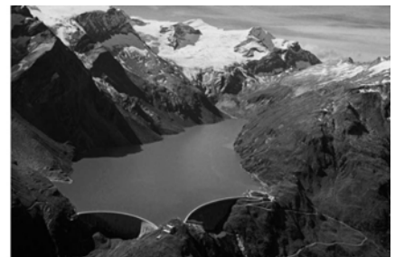
von links: Ausblick von der Saukaralm, Edelweiß der alpinen Hochlagen, Mädchentracht aus Salzburg, Stausee des Wasserkraftwerkes Kaprun