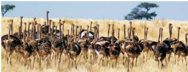
Afrikanische Strauße ( Struthio camelus )