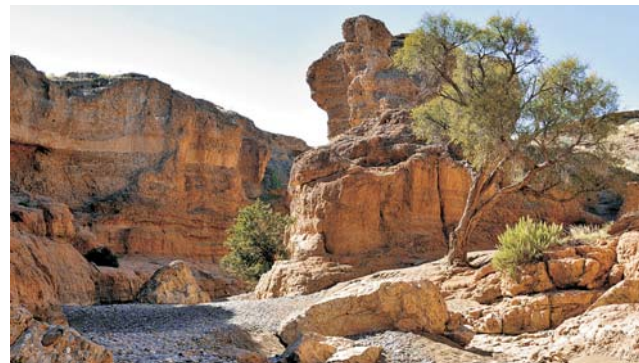
Weg durch den in der Trockenzeit begeharen Sesriem-Canyon

GEOPULS als Reiseveranstalter wurde 2004 von Dozenten des Geographischen Instituts in Tübingen gegründet und arbeitet seitdem mit ausgewählten Volkshochschulen zusammen. Begeisterte Geographen, die ein Land durch Ihre Arbeit während vieler Aufenthalte von allen Seiten kennen gelernt haben, führen Sie durch Kultur und Natur des jeweiligen Reisezieles. Bei einer Reise mit Geographen gibt es, neben den touristischen Höhepunkten, immer noch etwas mehr zu sehen und zu erleben. Wenig Bekanntes, tiefe Einblicke, das Erkennen von Zusammenhängen in Kultur- und Naturraum, Hintergründiges. Ausflüge in die Natur mit der einen oder anderen kleinen Wanderung gehören dazu, um auch die landschaftlichen Besonderheiten und deren Schönheit kennenzulernen und zu genießen. Die Teilnehmerzahl ist je nach Reise auf angenehme 12 bis max. 16 Personen beschränkt, was auch noch ein Reisen abseits massentouristischer Strukturen ermöglicht.