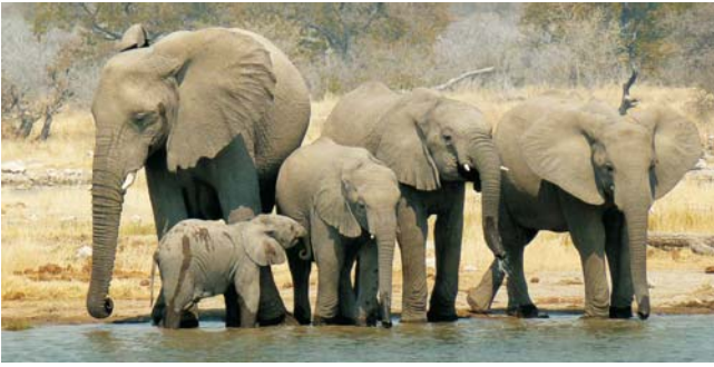
In der winterlichen Trockenzeit (Juli/August) treffen wir nicht nur die großen Zebra-, Antilopen- und Gnu-Herden an den verbliebenen Wasserlöchern - hinzu gesellen sich alle Großtierarten, vom Elefanten bis zum Löwen