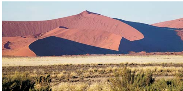
die Dünen im Sossusvlei zählen mit zu den höchsten der Welt

dieser Folder wurde CO 2 -neutral hergestellt