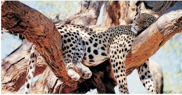
Kleines Nickerchen im Etosha-Nationalpark

Nach der Anmeldung zu dieser Exkursion wird mit der von GEOPULS zugesandten Buchungsbestätigung eine Anzahlung (15 % des Reisepreises) fällig. Die Restzahlung erfolgt zwei Wochen vor Reisebeginn. Es gelten die Geschäftsbedingungen des Veranstalters: Geopuls GbR, Neckarhalde 62, 72108 Rottenburg (Tel. 07472-9808802). Bitte beachten Sie vor Reisebuchung unsere Allgemeinen Reisebedingungen sowie das Formblatt zur Unterrichtung des Reisenden bei einer Pauschalreise nach § 651a des BGB (EU-Richtlinie 2015/2302). Beides schicken wir vor Buchung gerne zu, oder kann auf/von der Webseite www.geopuls.de eingesehen und ausgedruckt werden.