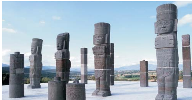
Tula: Kriegerstatuen aus der Zeit der Tolteken