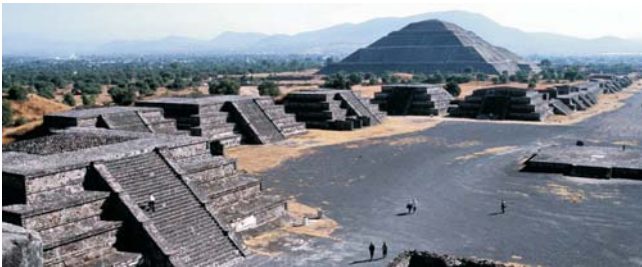
Teotihuacan: Totenallee und Mondpyramide

Nach der Anmeldung zu dieser Exkursion wird mit der von GEOPULS zugesandten Buchungsbestätigung eine Anzahlung (15 % des Reisepreises) fällig. Die Restzahlung erfolgt zwei Wochen vor Reisebeginn. Es gelten die Geschäftsbedingungen des Veranstalters: Geopuls-Studienreisen, Neckarhalde 62, 72108 Rottenburg a.N. (Tel. 07472-9808802). Die Allgemeinen Reisebedingungen werden gerne vorab zugeschickt oder können auf/von der Geopuls-Homepage www.geopuls.de eingesehen oder ausgedruckt werden.