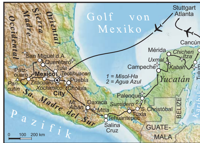
Reiseroute im Süden Mexikos mit 12 UNESCO-Welterbestätten

dieser Folder wurde CO 2 -neutral hergestellt