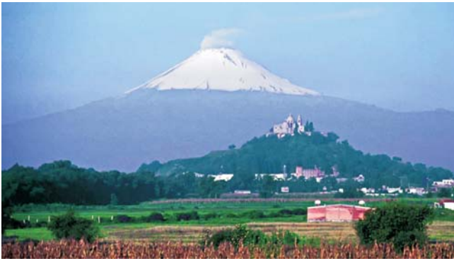
Cholula: Pyramide mit Kathedrale vor dem rauchenden Popocatepetl (5462 m)