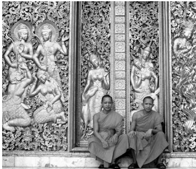
Mönche im Wat Aham, Luang Prabang

GEOPULS steht für ganz besondere Reiseerlebnisse. Nicht Reiseleiter wie man sie überall findet, sondern begeisterte Geographen, die zu Natur und Kultur eines Landes wirklich etwas zu sagen haben, bilden die Mannschaft von Geopuls. Als Reiseveranstalter für alle interessierten und reisefreudigen Menschen ist Geopuls aus dem Geographischen Institut der Universität Tübingen heraus entstanden. Unter dem Dach von Geopuls bietet sich Ihnen die Gelegenheit beliebte Reiseziele in Begleitung eines Geographiedozenten oder Diplom-Geographen intensiv und auch einmal anders zu erleben. Dabei geht es keineswegs akademisch zu. Geographen sind Genießer und schenken Kunst, Kultur und Geschichte ebensoviel Aufmerksamkeit wie der Landesnatur. Themen zu Geologie, Klima, Vegetation und Landschaft nehmen auf unseren Exkursionen genauso viel Raum ein wie die kulturellen Schönheiten. Mit Geographen unterwegs zu sein, heißt in einer Gruppe Gleichgesinnter ohne fakultative Zwänge zu reisen, zu genießen und die Welt besser zu verstehen.