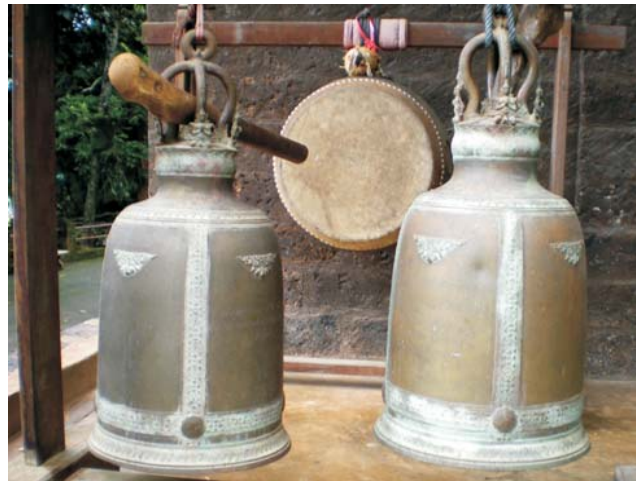
Wat Phra That Pu Khao, Mae Sai / Mekong

dieser Folder wurde CO 2 -neutral hergestellt