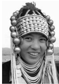
Akha im Norden Thailands

Nach der Anmeldung zu dieser Exkursion wird mit der von GEOPULS zugesandten Buchungsbestätigung eine Anzahlung (15 % des Reisepreises) fällig. Die Restzahlung erfolgt zwei Wochen vor Reisebeginn. Es gelten die Geschäftsbedingungen des Veranstalters: Geopuls-Studienreisen, Neckarhalde 62, 72108 Rottenburg a.N. (Tel. 07472-9808802). Die Allgemeinen Reisebedingungen werden gerne vorab zugeschickt. Sie können bei der VHS eingesehen, oder auch von der Homepage www.geopuls.de ausgedruckt werden.