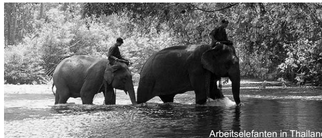
Arbeitselefanten in Thailand

Historische Kulturgüter ersten Ranges, faszinierende Landschaften, ethnische Vielfalt und die Tatsache, daß beide Länder über exzellente und vielseitige Küchen verfügen, machen die Reise besonders reizvoll.