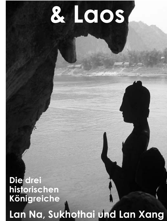
Höhlen von Pak Ou am Mekong/Laos