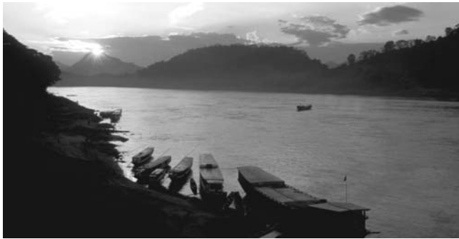
Abendstimmung am Mekong