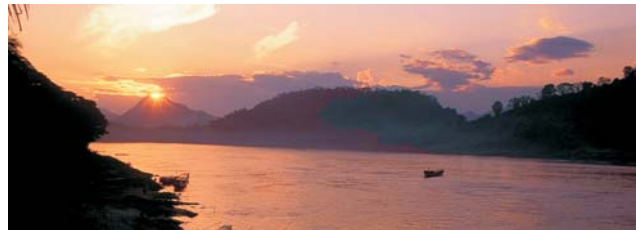
Abendstimmung am Mekong

GEOPULS als Reiseveranstalter wurde 2004 von Dozenten des Geographischen Instituts in Tübingen gegründet und arbeitet seitdem mit ausgewählten Volkshochschulen zusammen. Begeisterte Geographen, die ein Land durch Ihre Arbeit während vieler Aufenthalte von allen Seiten kennen gelernt haben, führen Sie durch Kultur und Natur des jeweiligen Reisezieles. Bei einer Reise mit Geographen gibt es, neben den touristischen Höhepunkten, immer noch etwas mehr zu sehen und zu erleben. Wenig Bekanntes, tiefe Einblicke, das Erkennen von Zusammenhängen in Kultur- und Naturraum, Hintergründiges. Ausflüge in die Natur mit der einen oder anderen kleinen Wanderung gehören dazu, um auch die landschaftlichen Besonderheiten und deren Schönheit kennenzulernen und zu genießen. Die Teilnehmerzahl ist je nach Reise auf angenehme 12 bis max. 16 Personen beschränkt, was auch noch ein Reisen abseits massentouristischer Strukturen ermöglicht.