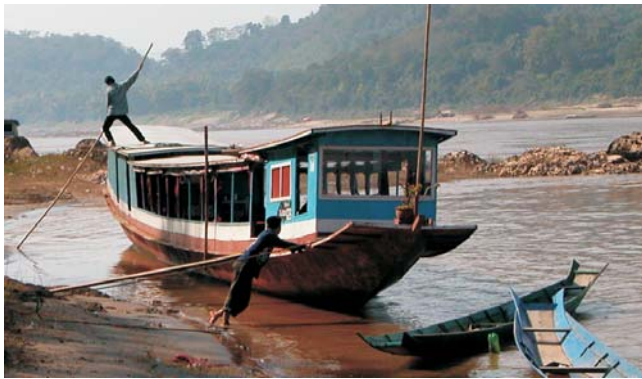
Boot in Pak Beng am Mekong / Laos