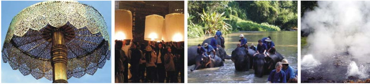
von links nach rechts: goldener Schirm im Wat Phra That Doi Suthep, Loy Kratong-Fest im November, Elefanten und heiße Quellen

Unterkunft: **** Lanna Palace 2004 Hotel in Chiang Mai (3 Übernachtungen)