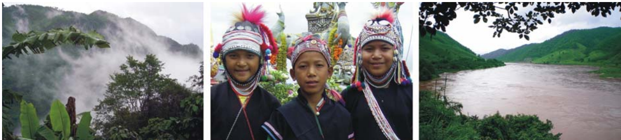
von links nach rechts: Kaffee- und Teeregion um den Doi Tung nahe der Grenze zu Burma, Akha-Kinder, Mekong – der längste Fluss SE-Asiens

Unterkunft: *** Imperial Golden Triangel Resort Chiang Saen (3 Übernachtungen)