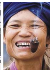
von links nach rechts: Elefanten bei Chiang Mai, Yao in traditioneller Kleidung, bemalte Sonnenschirme von Bo Sang, Karen-Frau mit Pfeife