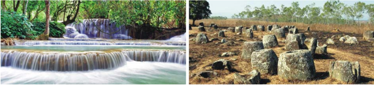
Kaskaden unterhalb des Tat Kuan Si-Wasserfalls bei Luang Prabang (links) und die mysteriöse Ebene der Tonkrüge bei Phonsavan (rechts)

■ Tat Kuan Si Wasserfall: in einem naturnahen Wald unweit von Luang Prabang treffen wir auf besonders schöne Wasserfälle. Unterhalb des Hauptwasserfalls befinden sich mehrere kaskadenartigen Becken in einer, an eine Märchenlandschaft erinnernde Umgebung (beliebtes Ausflugsziel für Einheimische und eventuell Gelegenheit zum Baden).