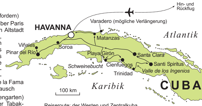
Reiseroute: der Westen und Zentralkuba