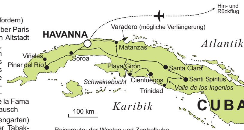
Reiseroute: der Westen und Zentralkuba