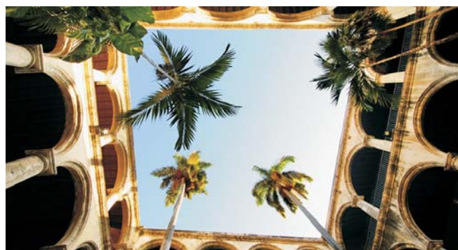
Innenhof aus der Kolonialzeit

Tel.: 07071-9426412, 0151-19639831, h.borger@geopuls.de