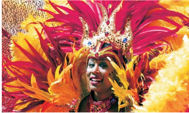
... sowie Karneval in Havanna / Kuba