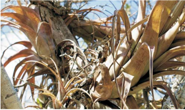
Ähnlichkeit der Formen: Bromelien und Tillantien in der einzigartigen Natur ...