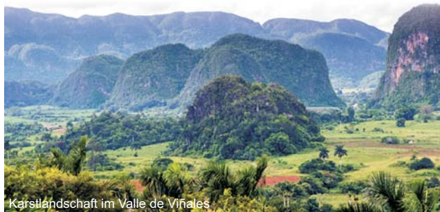
Karstlandschaft im Valle de Viñales

Wer die traumhaften Sandstrände nach der Rundreise noch ein paar Tage genießen möchte, dem bieten wir auf Wunsch als Zubuchung eine dreitägige Verlängerung zum Badevergnügen.