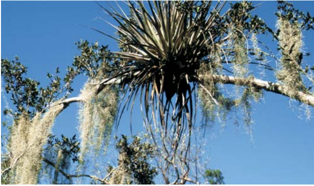
Ähnlichkeit der Formen: Bromelien und Tillantien in der einzigartigen Natur ...