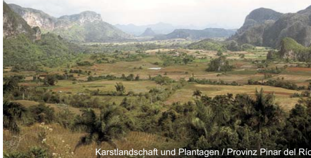
Karstlandschaft und Plantagen / Provinz Pinar del Río

Heiße Salsa-Rhythmen und klassische Autos der 50er Jahre, Che Guevara und Fidel Castro, paradiesische Karibikstrände und verträumte Städte im spanischen Kolonialstil, Rum, Zuckerrohr und kubanische Zigarren, einzigartige tropische Vegetation und Landschaften – Kuba! In kaum einem anderen Land treffen Sie auf so viel Abwechslung, Charme und Lebensfreude. Mit dem in Lateinamerika aufgewachsenen Geographen (Tübingen) deutscher Eltern ist ein echtes Kuba-Gefühl garantiert. Vor über 50 Jahren im Fokus der Weltpolitik, hat Kuba auf der einen Seite Bildungs- und Gesundheitssysteme entwickelt, die zu den höchstentwickeltesten der Welt zählen. Demgegenüber steht eine marode Wirtschaft, die sich erst heute, nach Verständigung mit den USA, langsam erholt. Die Zusammenhänge zwischen der lebendigen Kultur, den traumhaften Landschaften und den Menschen auf Kuba stehen bei dieser Reise im Vordergrund. So bereisen Sie nicht nur die touristisch bekannten Städte, sondern blicken, unterwegs mit einem Geographen sowie einem lizenzierten einheimischen Führer, auch hinter die Kulissen, u.a. in einer Zigarrenfabrik, einer Töpferwerkstatt, im Gespräch mit einem kubanischen Künstler, sowie in der phantastischen Karstlandschaft im Westen Kubas. Wer die traumhaften Sandstrände nach der Rundreise noch ein paar Tage genießen möchte, dem bieten wir auf Wunsch als Zubuchung eine 2-3-tägige Verlängerung zum Badevergnügen.