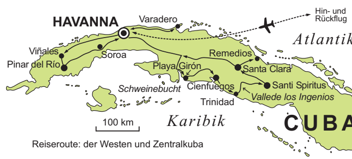
Reiseroute: der Westen und Zentralkuba

GEOPULS als Reiseveranstalter wurde 2004 von Dozenten des Geographischen Instituts in Tübingen gegründet und arbeitet seitdem mit ausgewählten Volkshochschulen zusammen. Begeisterte Geographen, die ein Land durch Ihre Arbeit während vieler Aufenthalte von allen Seiten kennen gelernt haben, führen Sie durch Kultur und Natur des jeweiligen Reisezieles. Bei einer Reise mit Geographen gibt es, neben den touristischen Höhepunkten, immer noch etwas mehr zu sehen und zu erleben. Wenig Bekanntes, tiefe Einblicke, das Erkennen von Zusammenhängen in Kultur- und Naturraum, Hintergründiges. Ausflüge in die Natur mit der einen oder anderen kleinen Wanderung gehören dazu, um auch die landschaftlichen Besonderheiten und deren Schönheit kennenzulernen und zu genießen. Die Teilnehmerzahl ist je nach Reise auf angenehme 12 bis max. 16 Personen beschränkt, was auch noch ein Reisen abseits massentouristischer Strukturen ermöglicht.