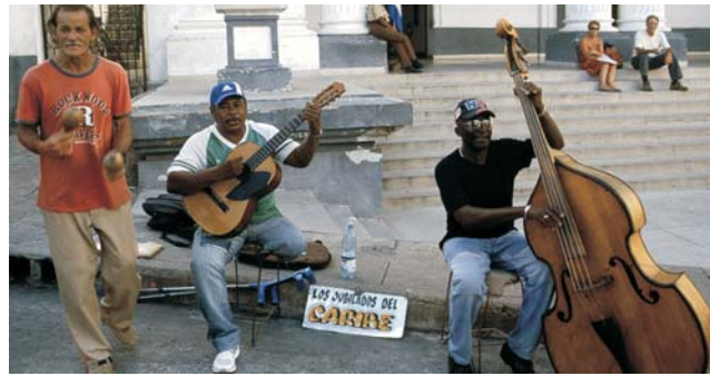
Son, Rumba, Mambo, Salsa, oder Trova - Kuba ist Musik

dieser Folder wurde CO 2 -neutral hergestellt