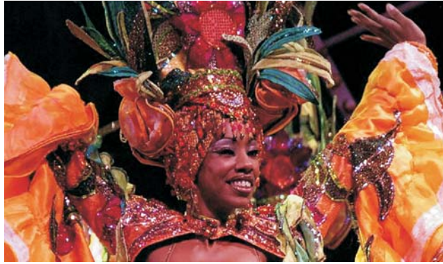
... sowie Karneval in Havanna / Kuba