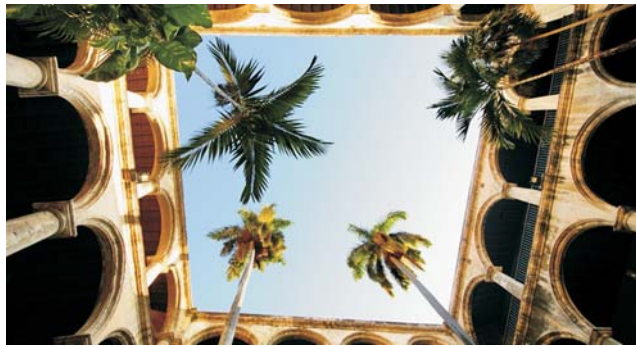
Innenhof aus der Kolonialzeit

dieser Folder wurde CO 2 -neutral hergestellt