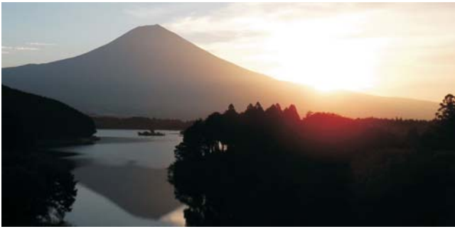
Fuji San und der See Tanuki bei Sonnenuntergang