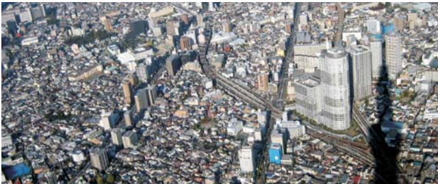
Japans Hauptstadt vom 634 m hohen Tokyo Skytree (Schatten)

Teilnehmerzahl: min. 12 Personen, max. 18 Personen