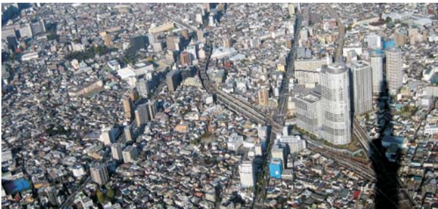
Japans Hauptstadt vom 634 m hohen Tokyo Skytree (Schatten)

* vorbehaltlich starke Wechselkursschwankungen und Flugpreiserhöhungen Teilnehmerzahl: max. 18 Personen