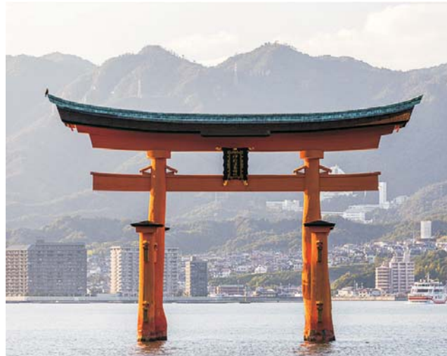
Itsukushima Schrein in Hiroshima