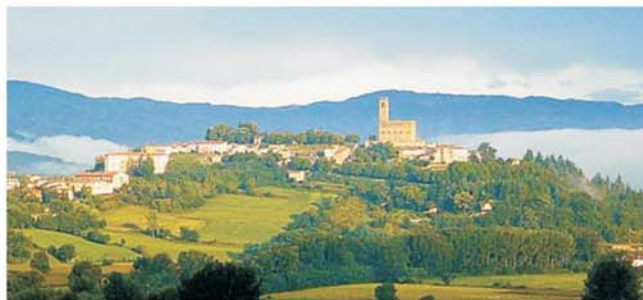
Poppi im Casentino zählt zu den schönsten Dörfern Italiens

GEOPULS als Reiseveranstalter wurde 2004 von Dozenten des Geographischen Instituts in Tübingen gegründet. Durch die Zusammenarbeit mit der VHS bietet sich Ihnen die Gelegenheit, beliebte Reiseziele mit uns einmal anders, von allen Seiten und möglichst authentisch zu erleben. Begeisterte Geographen, die zu Natur und Kultur eines Landes durch ihre eigene Arbeit wirklich etwas zu sagen und zu zeigen haben, bilden die Reiseleiter-Mannschaft von GEOPULS. Für uns ist es, neben dem Kennenlernen von Kultur und Menschen, genauso wichtig auch der Landesnatur alle Aufmerksamkeit zu schenken. Ausflüge, kleine Wanderungen oder Spaziergänge gehören deshalb zu jeder Reise mit dazu, um das Besondere von Landschaft, Vegetation, usw. auch hautnah erleben, genießen und verstehen zu können. Die Gruppengröße ist mit max. 11-16 Teilnehmern immer angenehm und überschaubar.