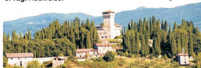
Castello del Trebbio, Ziel der landschaftskundlichen Wanderung am 4. Tag