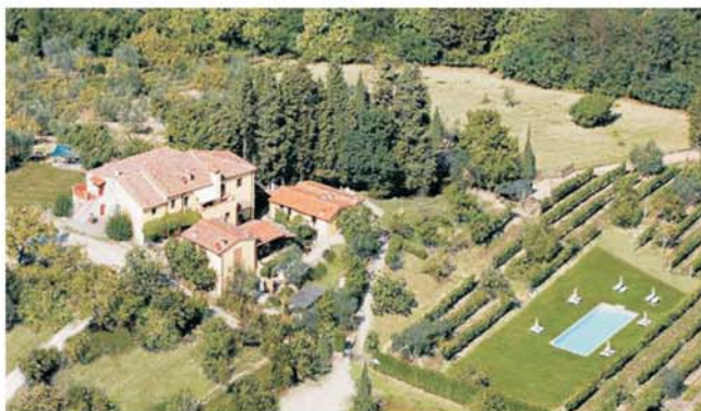
Blick von oben auf unsere authentisch toskanische Unterkunft in den Hügeln östlich von Florenz bei Rufina, Ursprungsort des berühmten Chianti Rufina.

dieser Folder wurde CO 2 -neutral hergestellt