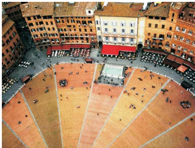
die Piazza del Campo in Siena gilt als einer der schönsten Plätze der Welt

Das umfangreiche Programm ist bewusst sehr abwechslungsreich gestaltet. Zwischen Tagesausflügen, u.a. in Städte wie Florenz, Siena und Arezzo mit umfangreichem Besichtigungsprogramm, sind immer wieder auch Tage für die Seele mit schönen Natur- und Landschaftserlebnissen, inklusive kleiner Wanderungen und Spaziergängen eingebaut. Auf diese Weise sollen Sie auch die herrliche Natur- und Kulturlandschaft der Toskana hautnah erleben und verstehen können. Dabei ist sicherlich gerade die gebirgige, waldreiche östliche Toskana besonders hervorzuheben. Es ist dies die waldreichste Gegend Italiens überhaupt. Diese ruhige, ländliche Toskana bietet dabei aber nicht nur Natur-, sondern auch ganz besondere Kulturgenüsse abseits der üblichen Touristenpfade.