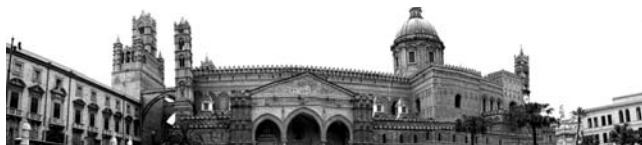
Bischofspalast und Kathedrale von Palermo

Nach der Anmeldung zu dieser Exkursion wird mit der von GEOPULS zugesandten Buchungsbestätigung eine Anzahlung (15 % des Reisepreises) fällig. Die Restzahlung erfolgt zwei Wochen vor Reisebeginn. Es gelten die Geschäftsbedingungen des Veranstalters: Geopuls-Studienreisen, Neckarhalde 62, 72108 Rottenburg a.N. (Tel. 07472-9808802). Die Allgemeinen Reisebedingungen werden gerne vorab zugeschickt. Sie können bei der VHS eingesehen, oder auch von der Homepage www.geopuls.de ausgedruckt werden.