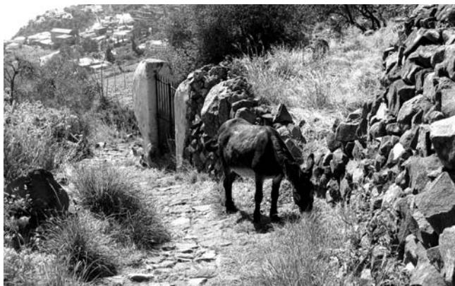
Alte Eselspfade auf der Äolen-Insel Filicudi (UNESCO Weltnaturerbe) laden ein zum Wandern und Entdecken der herrlichen Natur.

GEOPULS bietet in ausschließlicher Zusammenarbeit mit der VHS Studienreisen für Menschen, die zu gleichen Teilen Kultur und Natur eines Landes in einer kleinen, gemütlichen Gruppe Gleichgesinnter intensiv kennen lernen möchten. Alle Studienreisen werden von begeisterten Geographen geführt, die sowohl zu Natur als auch Kultur eines Landes durch ihren wissenschaftlichen Hintergrund und ihre spezielle Landeskenntnis wirklich etwas zu sagen und zu zeigen haben. Als Reiseveranstalter wurde Geopuls 2004 von Dozenten des Geographischen Instituts der Uni Tübingen gegründet und bis heute betrieben. Das Erfolgsrezept ist, beliebte Reiseziele möglichst authentisch, und auch einmal anders als gewöhnlich zu entdecken. Dabei sind Geographen Genießer und schenken dem Landestypischen, Kunst, Kultur und Geschichte ebensoviel Aufmerksamkeit wie der Landesnatur. Gerade das Zusammenspiel mit der Natur (Geologie, Klima, Vegetation, landschaftsökologische Zusammenhänge), für jedermann verständlich erklärt, machen ein Reiseziel erst ganzheitlich erlebbar. Kleine Wanderungen in die Natur und Ausflüge zu diesen Themen fehlen deshalb bei keiner Reise.