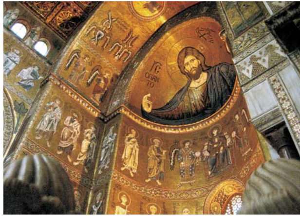
Christus Pantokrator in der Apsis des Goldenen Doms von Monreale