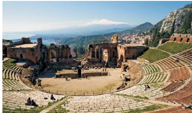
Blick vom Teatro Greco in Taormina zum schneebedeckten Ätna-Gipfel

dieser Folder wurde CO 2 -neutral hergestellt