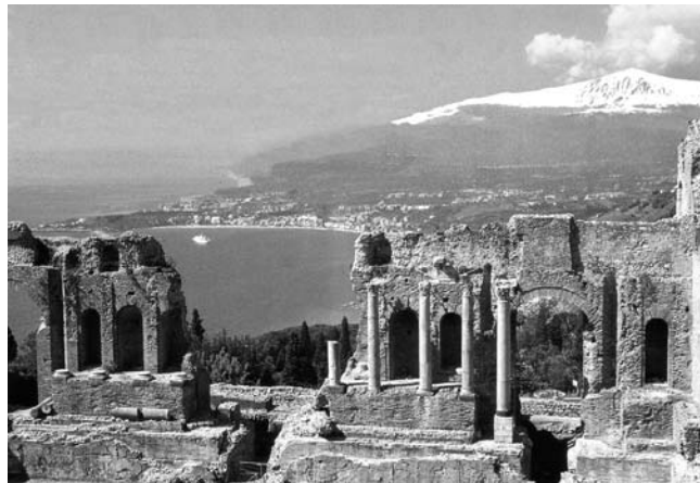
Blick vom Teatro Greco in Taormina zum schneebedeckten Ätna-Gipfel

GEOPULS bietet in ausschließlicher Zusammenarbeit mit der VHS Studienreisen für Menschen, die zu gleichen Teilen Kultur und Natur eines Landes in einer kleinen, gemütlichen Gruppe Gleichgesinnter intensiv kennen lernen möchten. Alle Studienreisen werden von begeisterten Geographen geführt, die sowohl zu Natur als auch Kultur eines Landes durch ihren wissenschaftlichen Hintergrund und ihre spezielle Landeskenntnis wirklich etwas zu sagen und zu zeigen haben. Als Reiseveranstalter wurde Geopuls 2004 von Dozenten des Geographischen Instituts der Uni Tübingen gegründet und bis heute betrieben. Das Erfolgsrezept ist, beliebte Reiseziele möglichst authentisch, und auch einmal anders als gewöhnlich zu entdecken. Dabei sind Geographen Genießer und schenken dem Landestypischen, Kunst, Kultur und Geschichte ebensoviel Aufmerksamkeit wie der Landesnatur. Gerade das Zusammenspiel mit der Natur (Geologie, Klima, Vegetation, landschaftsökologische Zusammenhänge), für jedermann verständlich erklärt, machen ein Reiseziel erst ganzheitlich erlebbar. Kleine Wanderungen in die Natur und Ausflüge zu diesen Themen fehlen deshalb bei keiner Reise.