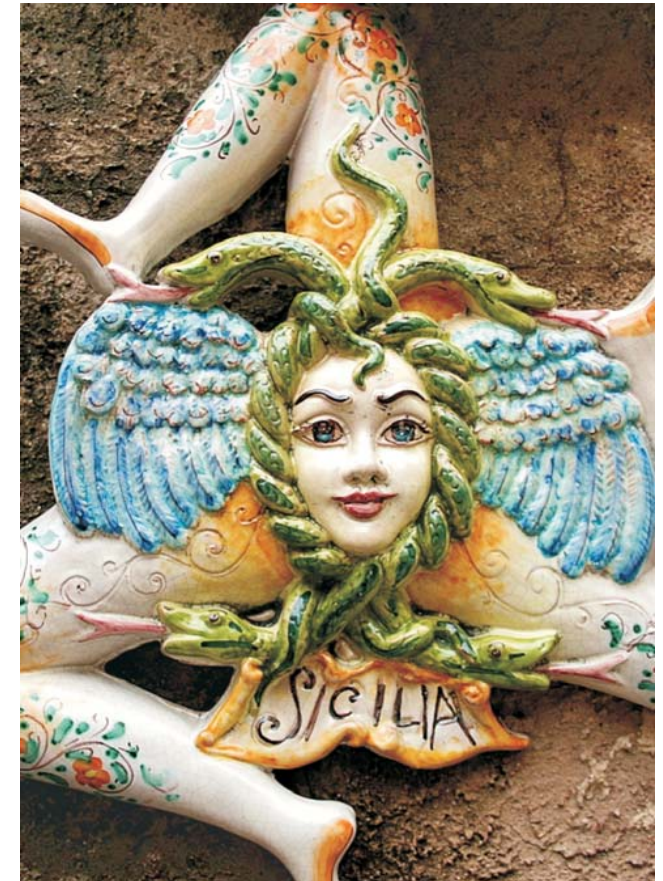
Trinacria - mythologisches Symbol und antiker Name für die Insel Sizilien