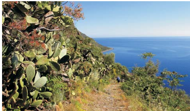
Alter Eselspfad auf der Äolen-Insel Filicudi (UNESCO Weltnaturerbe)

GEOPULS als Veranstalter für alle am Reisen interessierten Menschen wurde 2004 von Dozenten des Geographischen Instituts in Tübingen gegründet und arbeitet seitdem mit der vhs zusammen. Begeisterte Geographen und Landeskundler, die Natur, Kultur und Hintergründe eines Ziellandes bestens vermitteln können, führen Sie bei diesen Exkursionen. Wir versuchen dabei, ein Land möglichst umfassend zu bereisen, was bedeutet, dass neben den berühmten Sehenswürdigkeiten auch die Landesnatur Beachtung und Erklärung findet. Kleine Wanderungen und Spaziergänge in die Natur bieten deshalb immer wieder eine schöne und interessante Abwechslung zum Kulturprogramm. Nicht zuletzt gilt es, ein Land so authentisch wie möglich zu erfahren und dabei auch die oft übersehenen kleinen Dinge zu entdecken. Dies funktioniert am besten in einer überschaubaren Gruppe, weshalb die Teilnehmerzahl auf 16 Personen begrenzt ist.