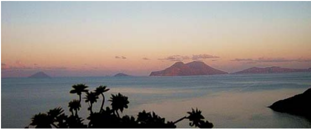
Abendstimmung: Blick von der Unterkunft auf Filicudi zu den anderen Inseln. Von links: Stromboli, Panarea, Salina, Lipari und ein Teil von Vulcano.

Nach der Anmeldung zu dieser Exkursion wird mit der von GEOPULS zugesandten Buchungsbestätigung eine Anzahlung (15 % des Reisepreises) fällig. Die Restzahlung erfolgt zwei Wochen vor Reisebeginn. Es gelten die Geschäftsbedingungen des Veranstalters: Geopuls GbR, Neckarhalde 62, 72108 Rottenburg (Tel. 07472-9808802). Bitte beachten Sie vor Reisebuchung unsere Allgemeinen Reisebedingungen sowie das Formblatt zur Unterrichtung des Reisenden bei einer Pauschalreise nach § 651a des BGB (EU-Richtlinie 2015/2302). Beides schicken wir vor Buchung gerne zu, oder kann auf/von der Webseite www.geopuls.de eingesehen und ausgedruckt werden.