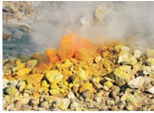
Fumarole im Solfatara-Krater