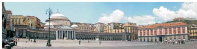
Neapel - Piazza Plebiscito (auch Titelbild)

dieser Folder wurde CO 2 -neutral hergestellt