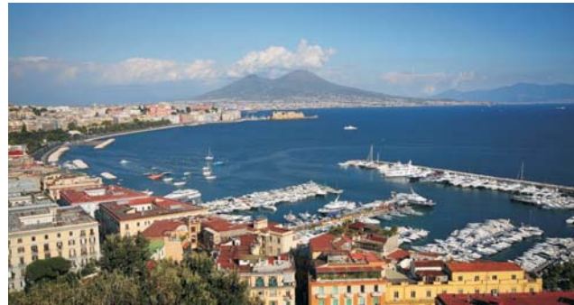
Blick vom Stadtviertel Posillipo Richtung Vesuv

Zentral, in einem der schönsten Stadtviertel Neapels um die Fußgängerzone der Piazza dei Martiri, nehmen wir Quartier in einem kleinen Hotel, das ausschließlich für unsere Gruppe von max. 16 Personen reserviert ist. Auch für eigene Entdeckungen, Bummeln, Einkaufen ist dies eine perfekte Ausgangslage. Von dort aus geht es einmal zu den Sehenswürdigkeiten der Stadt, ein andermal mit unserem kleinen Exkursionsbus zu Ausflügen in die Umgebung.