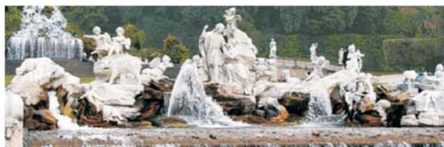
Venus & Adonis Brunnen im Schloßpark der Reggia von Caserta

GEOPULS als Spezialreiseveranstalter wurde 2004 von Dozenten des Geographischen Instituts der Uni Tübingen gegründet. Begeisterte Geographen und Landeskundler, die Natur, Kultur und Hintergründe eines Ziellandes bestens kennen, führen Sie bei diesen Reisen. Ein Land wird dabei geographisch möglichst umfassend bereist. Das bedeutet, dass neben den berühmten Sehenswürdigkeiten auch die Landesnatur mit seiner Vegetation, Landschaftsformen, etc. Beachtung und Erläuterung finden. Kleine Wanderungen und Spaziergänge in die Natur bieten deshalb immer wieder eine willkommene Abwechslung zum kulturellen Besichtigungsprogramm. Nicht zu letzt gilt es auch, ein Land so authentisch wie möglich zu erfahren. Dies funktioniert am besten in einer noch überschaubaren Gruppengröße, weshalb die max. Teilnehmerzahl je nach Reise auf 11-16 Personen begrenzt ist.