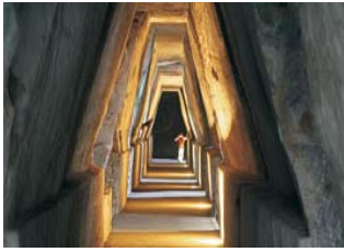
Cumä - Orakelhöhle der Sibylle