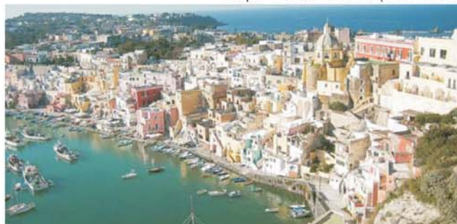
Marina di Corricella auf dem Inselchen Procida im Golf von Neapel

GEOPULS als Spezialreiseveranstalter wurde 2004 von Dozenten des Geographischen Instituts der Uni Tübingen gegründet. Begeisterte Geographen und Landeskundler, die Natur, Kultur und Hintergründe eines Ziellandes bestens kennen, führen Sie bei diesen Reisen. Ein Land wird dabei geographisch möglichst umfassend bereist. Das bedeutet, dass neben den berühmten Sehenswürdigkeiten auch die Landesnatur mit seiner Vegetation, Landschaftsformen, etc. Beachtung und Erläuterung finden. Kleine Wanderungen und Spaziergänge in die Natur bieten deshalb immer wieder eine willkommene Abwechslung zum kulturellen Besichtigungsprogramm. Nicht zu letzt gilt es auch, ein Land so authentisch wie möglich zu erfahren. Dies funktioniert am besten in einer noch überschaubaren Gruppengröße, weshalb die max. Teilnehmerzahl je nach Reise auf 11-16 Personen begrenzt ist.