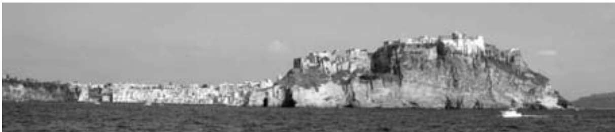
Procida – Marina di Coricella mit Terra Murata

3. Tag: Procida. Nach dem Frühstück geht es mit dem Schiff zur Insel Procida. Die Fahrt dauert etwas mehr als eine Stunde und bietet endlich die Gelegenheit, die herrliche Kulisse von Neapel und der Phlegräischen Felder vom Meer aus zu betrachten. Durch Konsens seiner Bewohner und Dank der als Tourismusmagnet wirkenden Nachbarinsel Ischia, blieb das kleine Procida vom Massentourismus bisher verschont und präsentiert sich als echtes Kleinod. Als im Meer ertrunkener Teil der Phlegräischen Felder ist die Insel vulkanischen Ursprungs. Die fruchtbaren Vulkanböden sowie das ebene Relief des Inselkerns bieten ideale Voraussetzungen für die Landwirtschaft, während die Küstenorte von der immer noch existierenden Kleinfischerei mit malerischen Fischerbooten geprägt sind. An den steilen Inselrändern gibt es äußerst sehenswerte Orte, die man vielleicht eher auf einer griechischen Insel als im Golf von Neapel suchen würde. Den schönsten Ort, Marina di Coricella werden wir besuchen.