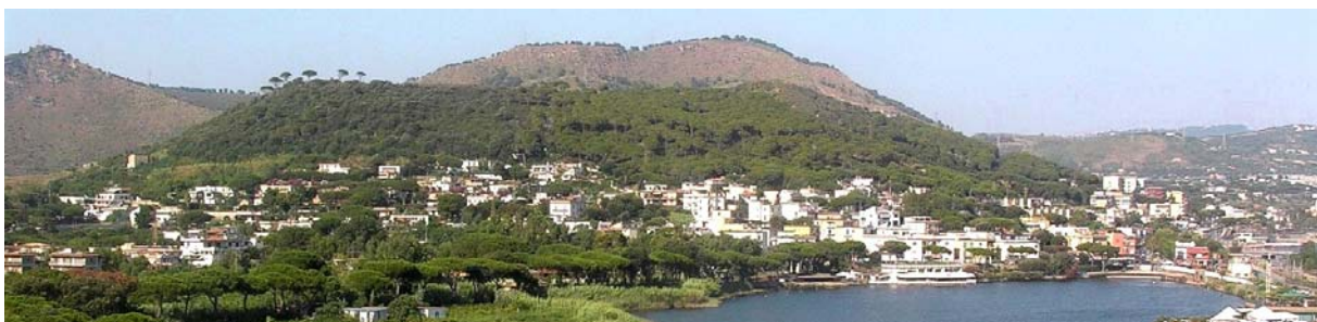
Monte Nuovo gesehen vom Lago di Lucrino

2. Tag: Phlegräische Felder - geographisch: Der Name dieses Vulkangebietes leitet sich vom griechischen phlegraios ab, was brennend oder glühend bedeutet. Der Ursprung der Phlegräischen Felder ist älter als der des benachbarten Vesuvs und zeigt sich in seiner Ausprägung sowie Formensprache wesentlich vielfältiger. Eine vor 39000 Jahren entstandene große Caldera, ein vulkano-tektonisches Einsturzgebiet, dehnt sich über ein Gebiet von mehr als 150 km 2 aus. Über 50 Eruptionszentren ganz unterschiedlichen Alters schaffen eine faszinierende Vulkanlandschaft. Darin liegt ein Teil des Stadtgebietes von Neapel (6. Tag) und die vulkanische Doppelinsel Procida-Vivara (4. Tag). Im Jahr 1538 ereignete sich die bisher letzte Eruption in den Phlegräischen Feldern. Innerhalb von 8 Tagen entstand dabei der ca. 130 m hohe Monte Nuovo, der „Neue Berg“. Dieser Ausbruch zog große Landschaftsveränderungen nach sich. Eine naturkundliche Wanderung auf den Monte Nuovo mit seiner außergewöhnlichen mediterranen Vegetation gehört zum heutigen Programm.