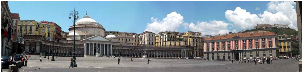
Neapel - Piazza del Plebiscito

Auf Wunsch vieler Teilnehmer der Exkursion 'Amalfiküste, Golf von Neapel & Cilento' haben wir eine weitere, ganz besondere Reise ins „glückliche Kampanien“ der Römer rund um den Golf von Neapel ausgearbeitet. Die Reise ist natürlich auch für Neueinsteiger gedacht und für diejenigen, die diese Region noch besser kennen lernen wollen. So führt die Reise zu großartigen Kultur- und Naturdenkmälern, die zum Teil sogar in die Liste des Weltkulturerbes der UNESCO aufgenommen wurden aber trotzdem nur selten Bestandteil von Reisen in diese Gegend sind.