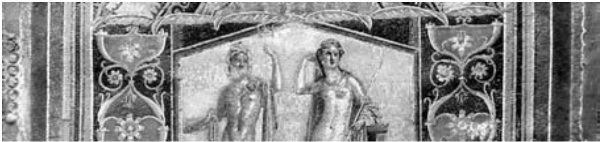
Herculaneum – Detail Brunnenmosaik Neptun und Amphitrite

Nach einer Mittagspause führt unser Weg zum Vesuv. Jedoch geht es heute nicht wie bei der Exkursion an die Amalfiküste (s. dort) auf den Gipfel und zum Krater, sondern wir wollen heute auf einer kleinen vulkanologisch-naturkundlichen Wanderung an der Bergflanke, ohne andere Touristen in der Stille der Natur, den Vulkan noch besser kennen lernen. Am späteren Nachmittag Rückfahrt nach Neapel.