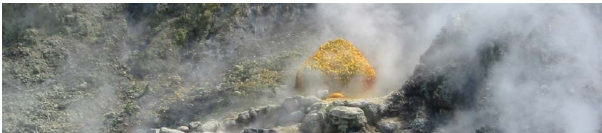
Bild: Fumarolendämpfe in der Solfatara

Vor dem Ausbruch des Monte Nuovo hat sich der Untergrund in wenigen Monaten um mehrere Meter gehoben und nach dem Ausbruch wieder abgesenkt. Dieses für hier typische Phänomen nennt man Bradisismus. An der antiken Markthalle von Pozzuoli, die direkt am Meer liegt und im 2. Jh. n. Chr. errichtet wurde, lassen sich diese „langsamen“ vertikalen Bewegungen der Erdoberfläche, über die letzten fast 2000 Jahre verfolgen: sobald die Markthalle unter den Meeresspiegel gelang, siedelten sich in den antiken Säulen Bohrmuscheln ( Lithophaga lithophaga ) an und hinterließen bis heute sichtbare Löcher. Die letzte Hebung (um zwei Meter) erfolgte zwischen 1982 bis 1984 und wurde von Erdbeben begleitet. Die Bevölkerung von Pozzuoli musste deshalb zeitweise evakuiert werden. Ein weiterer Höhepunkt dieses Tages ist die Besichtigung des Solfatara-Kraters. Er ist erst vor 4000 Jahren entstanden und kann noch mit vielfältigen postvulkanischen Erscheinungen aufwarten: man läuft direkt auf dem Kraterboden und kann brodelnde Schlammlöcher, schwefelwasserstoffhaltige Fumarolen, Mofetten, Thermalquellen... aus nächster Nähe beobachten. Um diese einzigartige vulkanische Landschaft zu schützen wurde 2003 der Regionalpark der Phlegräischen Felder eingerichtet.