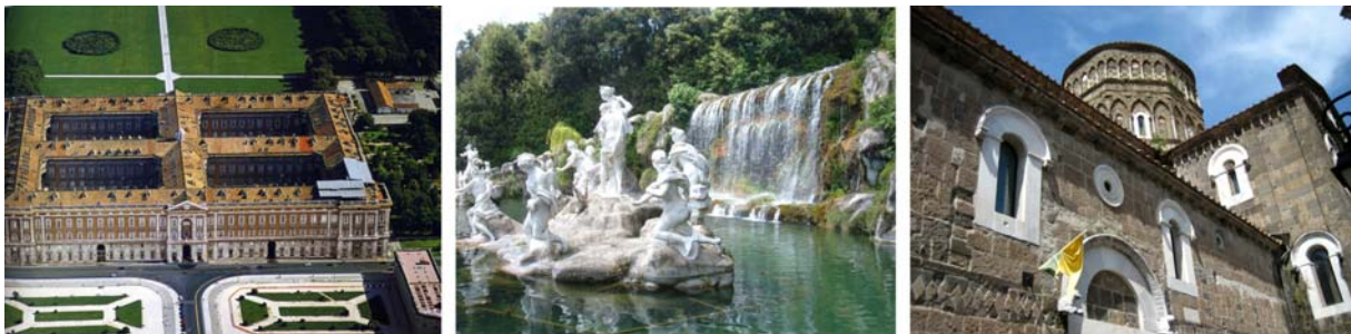
Königsschloß in Caserta, Detail des Diana-Brunnen im Park der Reggia, Normannendom im mittelalterlichen Caserta Vecchia

5. Tag: Königsschloss in Caserta (Weltkulturerbe) und Caserta Vecchia: Heute besuchen wir die 40 km entfernte Provinzhauptstadt Caserta. Hier liegt das beeindruckendste der vier neapolitanisch-bourbonischen Königsschlösser. Die Reggia ist eines der größten und prächtigsten Königsschlösser Europas. Es sollte einst das Schloss von Versaille übertreffen. Der gewaltige Bau hat eine Grundfläche von 247 x 184 Metern und verfügt über 1200 Räume. Besonders ist auch die prachtvolle Innenausstattung im Stil des Klassizismus. Die besten Architekten ihrer Zeit haben dem Bau sein heutiges Gesicht gegeben. Zeitgleich mit dem Palast wurde ein riesiger, über 120 ha großer, Schlosspark geschaffen. Die Parkanlage gehört zu den schönsten Europas und wurde entlang einer drei Kilometer langen Achse konzipiert. Die Mitte der Achse ist mit großen Wasserflächen und Kaskaden geschmückt, die im großen Diana-Brunnen ihren Höhepunkt finden. Das nötige Wasser dafür gelangt über ein 40 Kilometer langes Aquädukt in den Park. Alles zusammen ein Höhepunkt der bourbonischen Dynastie!