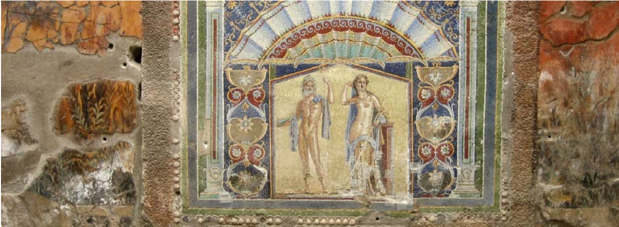
Herculaneum – Detail Brunnenmosaik Neptun und Amphitrite

Nach einer Mittagspause führt unser Weg zum Vesuv. Jedoch geht es nicht wie bei der Exkursion 'Amalfiküste, Golf von Neapel & Cilento' bis zum Kraterand, sondern wir wollen heute auf einer kleinen vulkanologisch-naturkundlichen Wanderung den Vulkan noch besser kennen lernen. Der letzte Ausbruch des Vesuvs war im Jahr 1944. Damals floß ein langsamer Lavastrom am Westhang des Vesuvs hinab auf die Stadt San Sebastiano zu. Dort werden wir hingehen und mit eigenen Augen beobachten wie sich dieser Lavastrom nach fast 70 Jahren verändert hat.