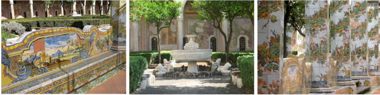
Neapel – im Majolika Kreuzgang von Santa Chiara

Mit der Funicolare einer Standseilbahn fahren wir anschließend bequem auf den Vomero-Hügel hinauf. Ein kurzer Fußweg führt uns zu einer der großartigsten Sehenswürdigkeiten Neapels, das Kartäuserkloster von San Martino. Im Rücken das Castel Sant'Elmo, genießt man von dort aus einen fantastischen Rundblick über die ganze Altstadt. Die Kartause besteht aus der prachtvollen Barockkirche: Chiesa delle Donne (Marmorintarsien, Deckenfresken von Lanfranco), dem eigentlichen Kloster und einem Terrassengarten, von dem aus sich wieder ein herrlicher Blick, diesmal über den Golf von Neapel, öffnet. Der Bau des Klosters geht auf das 14. Jh. zurück. Die Kartause beherbergt seit 1886 das Nationalmuseum der Stadt Neapel in dem Kunstschätze aus den letzten Jahrhunderten ausgestellt sind. Besonders hervorzuheben ist die einzigartige neapolitanische Krippenausstellung, die Krippe Cuciniello (Bild unten) besteht z.B. aus 162 Figuren, 80 Tieren, 28 Engeln und etwa 450 Miniaturgegenständen.