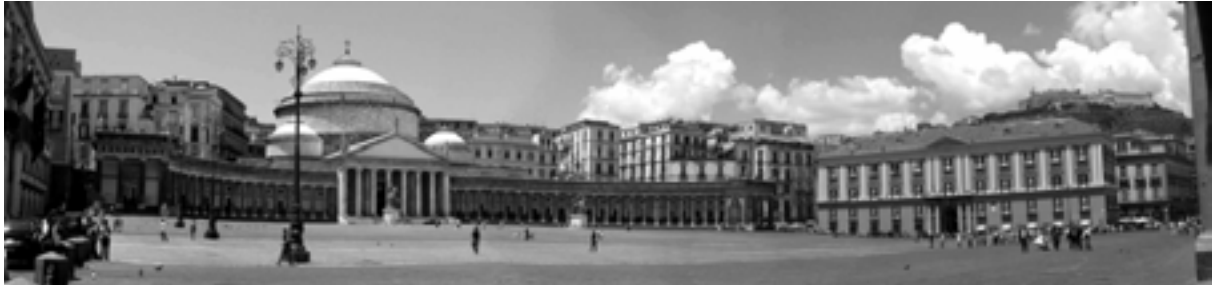
Neapel - Piazza del Plebiscito

Exkursionsleitung: Annette Brünger-Miletto