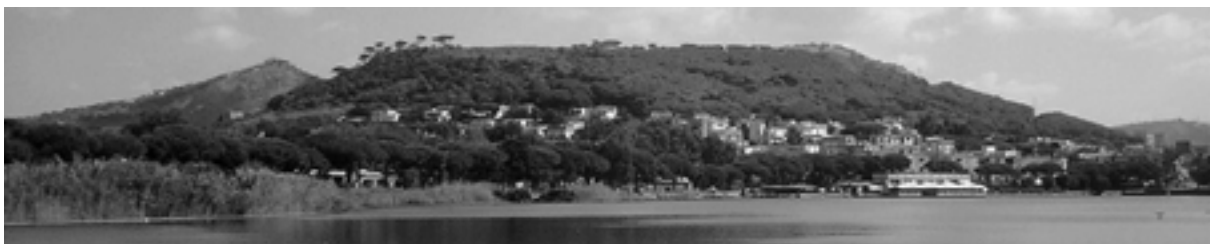
Monte Nuovo gesehen vom Lago Lucrino

5. Tag: Phlegräische Felder Teil II: Ende September 1538 ereignete sich die bisher letzte große Eruption auf den Phlegräischen Feldern. Innerhalb von 5 Tagen entstand dabei der 133 m hohe Monte Nuovo (Neuer Berg) mit einem Krater von etwa 400 m Durchmesser. Dieser Ausbruch zog große Landschaftsveränderungen nach sich. Das einst zum Meer offene Lucriner Vulkan-Maar, das schon für die römische Flotte ein perfekter Naturhafen war, wurde komplett vom Meer abgeschnitten und es entstand der viel kleinere heutige Lucriner See. Diese Landschaftsveränderungen und eine naturkundliche Wanderung auf den Monte Nuovo mit seiner außergewöhnlichen Macchien-Vegetation und schönen Ausblicken sind Programm des heutigen Vormittags. Der Nachmittag ist frei um eigenen Interessen / Entdeckungen / Einkäufen in Neapel nachzugehen.