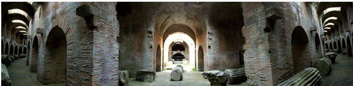
im Untergrund des flavischen Amphitheaters von Pozzuoli

Genau hier, in den Phlegräischen Feldern, wurde im 8. Jh. v. Chr., von Griechen aus Euböa, die erste griechische Kolonie auf dem Festland „Italiens“ gegründet: Cumä. Die Nähe zu den mit Eisen handelnden Etruskern war für die Standortwahl ausschlaggebend. Danach folgten südlich entlang der Küste weitere griechische Stadtgründungen wie Dikaiarchia (heute Pozzuoli) sowie Partenope und Neapolis (zusammen später Neapel). In der zweiten Hälfte des 4. Jh. v. Chr. gerät Kampanien langsam in den Einflussbereich Roms. Puteoli/Pozzuoli wurde ab dem Anfang des 2. Jh. v. Chr. der wichtigste Handelshafen Roms bis 62 n. Chr. der Hafen von Ostia in Betrieb genommen wurde. Ganz in der Nähe, in Misenum/Miseno, war ab 12 v. Chr. die römische Flotte stationiert. Überall an der Küste des Golfes von Neapel entstanden luxuriöse Ferienvillen der Aristokraten aus Rom und sogar der Kaiser selbst, die hier das milde Klima, die bezaubernde Landschaft und die warmen Thermalquellen schätzten. Wir beginnen unseren Tagesausflug in Pozzuoli mit der Besichtigung des flavischen Amphitheaters aus dem 1. Jh. Es ist das drittgrößte des römischen Reiches. Hier wurden vor allem Jagden auf exotische Raubtiere veranstaltet. Bei der Besichtigung der unterirdischen Räumlichkeiten wird klar, welche Organisation dafür nötig war.