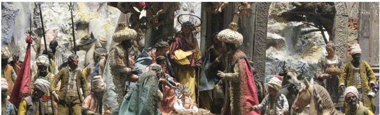
Ausschnitt Cuciniello-Krippe im Museum der Kartause von San Martino

Mit der Funicolare einer Standseilbahn fahren wir anschließend bequem auf den Vomero-Hügel hinauf. Ein kurzer Fußweg führt uns zu einer der großartigsten Sehenswürdigkeiten Neapels, das Kartäuserkloster von San Martino. Im Rücken das Castel Sant'Elmo, genießt man von dort aus einen fantastischen Rundblick über die ganze Altstadt. Die Kartause besteht aus der prachtvollen Barockkirche: Chiesa delle Donne (Marmorintarsien, Deckenfresken von Lanfranco), dem eigentlichen Kloster und einem Terrassengarten, von dem aus sich wieder ein herrlicher Blick, diesmal über den Golf von Neapel, öffnet. Der Bau des Klosters geht auf das 14. Jh. zurück. Die Kartause beherbergt seit 1886 das Nationalmuseum der Stadt Neapel in dem Kunstschätze aus den letzten Jahrhunderten ausgestellt sind. Besonders hervorzuheben ist die einzigartige neapolitanische Krippenausstellung, die Krippe Cuciniello (Bild unten) besteht z.B. aus 162 Figuren, 80 Tieren, 28 Engeln und etwa 450 Miniaturgegenständen.