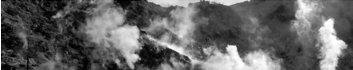
Bild: Fumarolen in der Solfatara

3. Tag: Procida. Nach dem Frühstück geht es mit dem Schiff zur Insel Procida. Die Fahrt dauert etwas mehr als eine Stunde und bietet endlich die Gelegenheit, die herrliche Kulisse von Neapel und der Phlegräischen Felder vom Meer aus zu betrachten. Durch Konsens seiner Bewohner und Dank der als Tourismusmagnet wirkenden Nachbarinsel Ischia, blieb das kleine Procida vom Massentourismus bisher verschont und präsentiert sich als echtes Kleinod. Als im Meer ertrunkener Teil der Phlegräischen Felder ist die Insel vulkanischen Ursprungs. Die fruchtbaren Vulkanböden sowie das ebene Relief des Inselkerns bieten ideale Voraussetzungen für die Landwirtschaft, während die Küstenorte von der immer noch existierenden Kleinfischerei mit malerischen Fischerbooten geprägt sind. An den steilen Inselrändern gibt es äußerst sehenswerte Orte, die man vielleicht eher auf einer griechischen Insel als im Golf von Neapel suchen würde. Den schönsten Ort, Marina di Coricella werden wir besuchen.