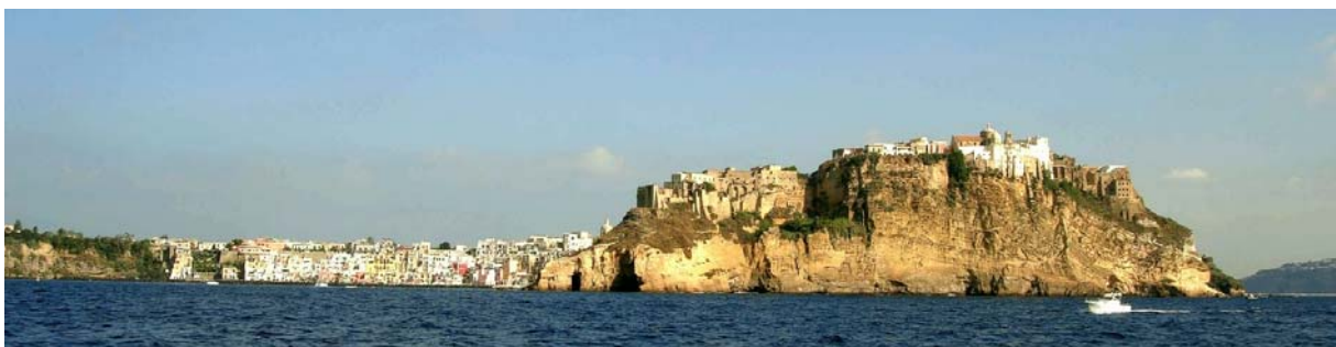
Procida – das Fischerörtchen Marina di Coricella neben dem Felsen der Terra Murata

4. Tag: Procida. Nach dem Frühstück geht es mit dem Schiff zur Insel Procida. Die Fahrt dauert etwas mehr als eine Stunde und bietet außerdem die schöne Gelegenheit, die herrliche Kulisse von Neapel und der Phlegräischen Felder vom Meer aus zu betrachten. Durch Konsens seiner Bewohner und Dank der als Tourismusmagnet wirkenden Nachbarinsel Ischia, blieb das kleine Procida vom Massentourismus bisher verschont und präsentiert sich als echtes Kleinod. Wie schon erwähnt zählt die Doppelinsel zu den Phlegräischen Feldern und ist vulkanischen Ursprungs. Die fruchtbaren Vulkanböden sowie das ebene Relief des Inselkerns bieten ideale Voraussetzungen für die Landwirtschaft, während die Küstenorte von der immer noch existierenden Kleinfischerei mit malerischen Fischerbooten geprägt sind. An den steilen Inselrändern gibt es äußerst sehenswerte Orte, die man vielleicht eher auf einer griechischen Insel als im Golf von Neapel suchen würde.