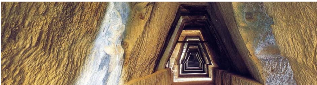
in der sog. Orakelhöhle der Sybille

Einfahrt in die Nachbarstadt Cuma führt bis heute durch den „Arco Felice“, ein zu Ehren von Kaiser Domitian errichtetes 20 Meter hohes Stadttor. Die Akropolis liegt auf einem Hügel am Meer. Die antike Stadtanlage besticht durch das Neben- und Übereinander griechischer, römischer und sogar byzantinischer Elemente. Die Bedeutung der Stadt steht im Zusammenhang mit dem Orakel der Sybille, verbunden mit der berühmten Geschichte um die Sybillinischen Bücher (520 v. Chr). Besonders beeindruckend ist die mystische Orakelhöhle und weitere, in den weichen Tuffstein gegrabene Tunnel und Durchbrüche. Unvergleichlich ist die Lage von Cumä in herrlicher Landschaft mit Blick weit über das Meer in einer fast biblisch anmutenden Szenerie der Ruinen zwischen alten Steineichen und Olivenbäumen. Da Cumä wegen seiner Abseitslage touristisch nicht so stark frequentiert ist, sind die Eindrücke umso schöner. Anmerkung: neueste Forschungen legen nahe, dass es sich bei der beeindruckenden Orakelhöhle der Sybille vielmehr um einen Teil des griechischen Verteidigungssystems (Wehrtunnel) der Stadt handelt. Die vermutlich echte, viel weniger spektakuläre Höhle der Sybille befindet sich demnach in der Nähe des Apollontempels.