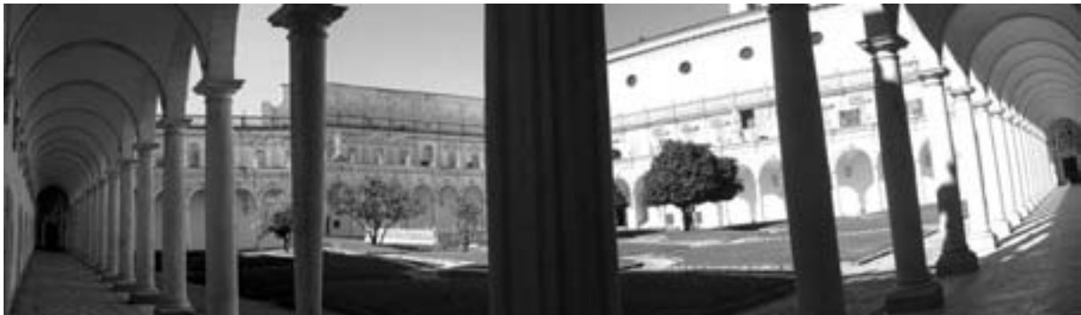
Neapel - großer Hof der Kartause von San Martino

zu den Luftschutzräumen des letzten Krieges. Weiter streifen wir einige schöne Plätze und Winkel, bevor wir uns mittags eine Pause in der Altstadt gönnen.