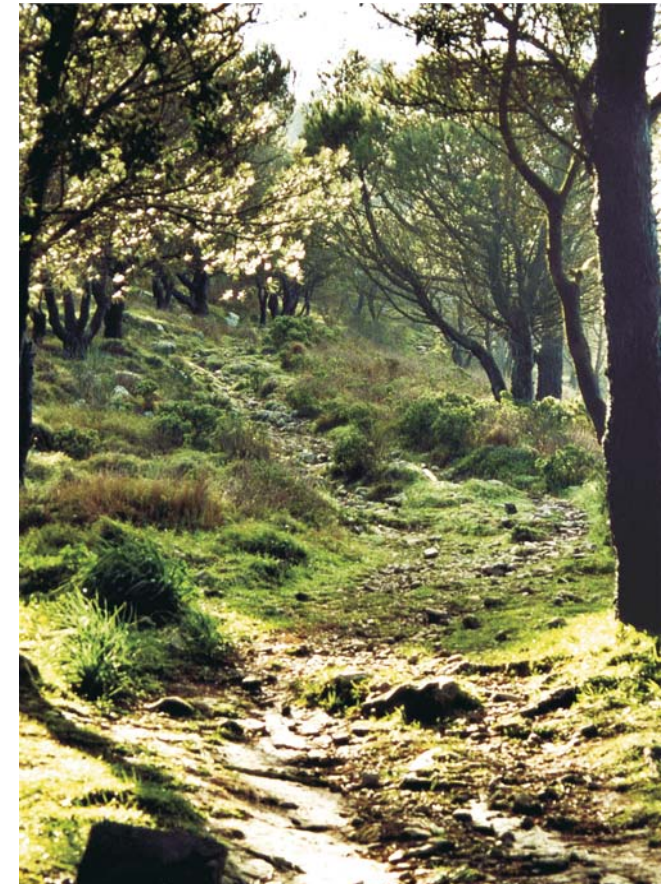
Alter Eselspfad am Monte Solaro, mit 589 m Capris höchste Erhebung