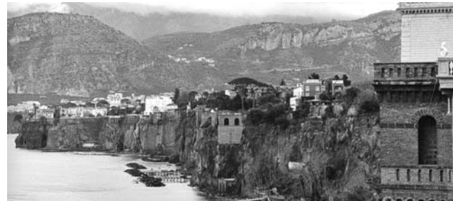
Auf der Rückreise von Capri besuchen wir Sorrent, das auf einer 35.000 Jahre alten Terrasse aus vulkanischem Tuff der Campi Flegrei erbaut wurde. Wir erkunden an diesem Tag auch die Nordküste der Halbinsel von Sorrent.

Eingerahmt wird das Inselprogramm von einem Tag Neapel und einem Tag an der Sorrentinischen Nordküste, mit besonderen Sehenswürdigkeiten, die bisher noch nicht auf dem Programm standen. Annette Brünger hat auch dieses Mal wieder eine ganz besondere Auswahl an Traumzielen ihrer Heimat am Golf von Neapel für Sie ausgewählt.