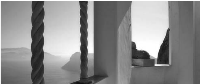
Blick von Axel Munthes Villa S. Michele zur Halbinsel von Sorrent

Nach der Anmeldung zu dieser Exkursion wird mit der von GEOPULS zugesandten Buchungsbestätigung eine Anzahlung (15 % des Reisepreises) fällig. Die Restzahlung erfolgt zwei Wochen vor Reisebeginn. Es gelten die Geschäftsbedingungen des Veranstalters: Geopuls-Studienreisen, Neckarhalde 62, 72108 Rottenburg a.N. (Tel. 07472-9808802). Die Allgemeinen Reisebedingungen werden gerne vorab zugeschickt. Sie können bei der VHS eingesehen, oder auch von der Homepage www.geopuls.de ausgedruckt werden.