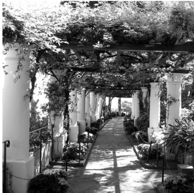
Loggia der Villa S. Michele in Anacapri

dieser Folder wurde CO 2 - neutral hergestellt