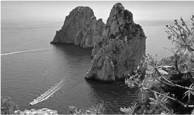
Faraglioni an der Südostküste Capris