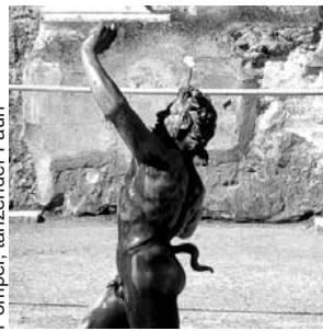
Pompeii, tanzender Faun