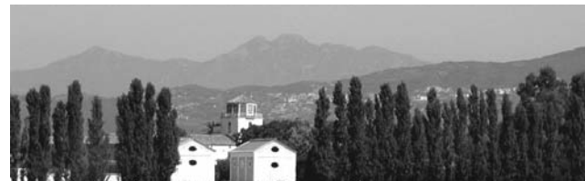
Unterkunft nahe des Cilento: Agriturismo und Bio-Landgut La Morella

Am sechsten Tag der Reise verlassen wir die Amalfiküste Richtung Süden ins Land der Mozzarella-Büffel. Auf einem historischen Landgut in der Sele-Ebene sind wir wieder mit viel italienischem Flair untergebracht. Neben der köstlichen Küche steht uns hier zusätzlich ein Pool im reizvollen Garten zur Verfügung. Von hier setzen wir die kontrastreiche Mischung aus Kultur- und Naturprogramm fort. Wir besichtigen die berühmten griechischen Tempel von Paestum und entdecken einen Teil des Cilento-Nationalparks (mit kleiner Wanderung), der wegen seiner Bedeutung und Schönheit von der UNESCO ebenfalls zum Welterbe erhoben wurde. Zusammen mit der Altstadt von Neapel, dem antiken Pompei und Paestum führt diese Exkursion zu insgesamt fünf Weltkulturerbestätten. Auch der Ausflug auf den Vesuv wird dabei natürlich nicht fehlen.