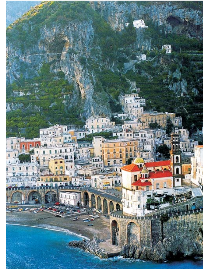
Atrani, Amalfis kleiner, idyllischer Nachbarort