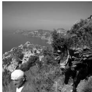
beim Wandern auf dem Götterweg