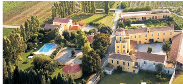
Unsere Agriturismo-Unterkunft nahe des Cilento ist dieses historische Landgut