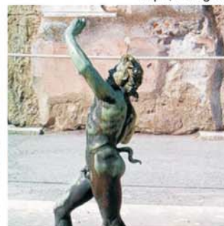
Pompeji, Tanzender Faun

GEOPULS als Reiseveranstalter wurde 2004 von Dozenten des Geographischen Instituts in Tübingen gegründet. Durch die Zusammenarbeit mit der VHS bietet sich Ihnen die Gelegenheit, beliebte Reiseziele mit uns einmal anders, von allen Seiten und möglichst authentisch zu erleben. Begeisterte Geographen, die zu Natur und Kultur eines Landes durch ihre eigene Arbeit wirklich etwas zu sagen und zu zeigen haben, bilden die Reiseleiter-Mannschaft von GEOPULS. Das Kennenlernen von Kultur und Menschen ist dabei nur die eine Hälfte. Ebensoviele Aufmerksamkeit schenken wir immer der Landesnatur. Ausflüge und Wanderungen in die Natur gehören deshalb zu jeder Reise mit dazu, damit Sie das Besondere von Landschaft, Vegetation, Geologie, usw. auch hautnah erleben genießen und verstehen können. Die Gruppengröße ist dabei je nach Reise mit max.11 bis max. 16 Teilnehmern immer angenehm überschaubar und macht so manches erst möglich.