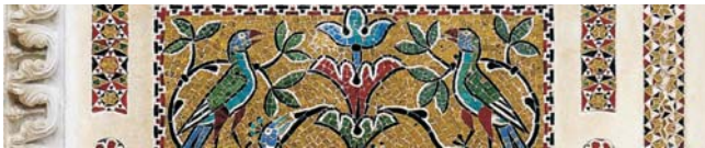
Detail eines mittelalterlichen Goldmosaiks im Dom von Ravello

Nach der Anmeldung zu dieser Exkursion wird mit der von GEOPULS zugesandten Buchungsbestätigung eine Anzahlung (15 % des Reisepreises) fällig. Die Restzahlung erfolgt zwei Wochen vor Reisebeginn. Es gelten die Geschäftsbedingungen des Veranstalters: Geopuls-Studienreisen, Neckarhalde 62, 72108 Rottenburg a.N. (Tel. 07472-9808802). Die Allgemeinen Reisebedingungen werden gerne vorab zugeschickt oder können auf/von der Geopuls-Homepage www.geopuls.de eingesehen oder ausgedruckt werden.