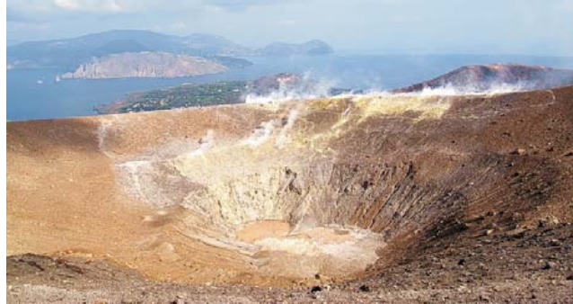
Vulcano - Gran Cratere (unten)

GEOPULS als Reiseveranstalter wurde 2004 von Dozenten des Geographischen Instituts in Tübingen gegründet und arbeitet seitdem mit ausgewählten Volkshochschulen zusammen. Begeisterte Geographen, die ein Land durch Ihre eigene Arbeit während vieler Aufenthalte von allen Seiten kennen gelernt haben, führen Sie durch Kultur- und Natur des jeweiligen Reisezieles. Bei einer Reise mit Geographen gibt es neben den touristischen Höhepunkten aber immer noch etwas mehr zu sehen und zu erleben. Wenig Bekanntes, tiefe Einblicke, das Erkennen von Zusammenhängen in Kultur- und Naturraum, Hintergründiges. Ausflüge in die Natur mit der einen oder anderen kleinen Wanderung gehören immer dazu, um auch die landschaftlichen Besonderheiten und deren Schönheit kennenzulernen und zu genießen. Die Teilnehmerzahl ist je nach Reise auf angenehme 12 bis max. 16 Personen beschränkt, was auch noch ein Reisen abseits massentouristischer Strukturen ermöglicht.