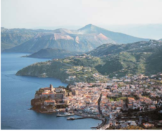
Blick über Lipari-Stadt zur Insel Vulcano mit dem rauchenden Gran Cratere