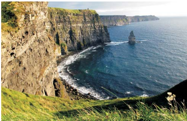
unvermittelt fallen die Cliffs of Moher 200 m steil zum Atlantik ab