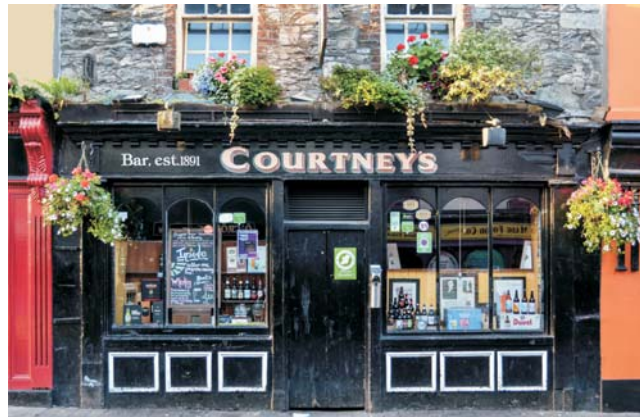
Typisch irisch: Pub in Killarney und Postmoderne, wie z.B. die umgestalteten Docklands mit der Samuel Beckett Bridge in Dublin

dieser Folder wurde CO 2 -neutral hergestellt