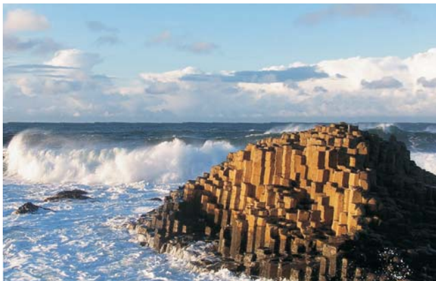
Giant's Causeway - einmalige Basaltlandschaft an der Nordküste Irlands

Wer Irland auf einer der schönsten Route über Land und entlang großartiger Küsten intensiv kennen lernen möchte, ist herzlich eingeladen, sich dieser Studienreise unter Leitung einer Tübinger Geographin anzuschließen. Sie hat, Ihrer Meinung nach, die vielfältigste 9-Tages-Tour durch Irland für Sie zusammengestellt, oft übersehene Perlen am Rande des Weges inklusive. Die Route beginnt in der impulsiven Hauptstadt Dublin, quert das Land von Ost nach West und führt entlang der grandiosen Westküste, bis in das zu Großbritannien gehörende Nord-Irland. Von Dublin bis Derry stößt man dabei auf einmalige Zeugnisse irischer Kultur und Naturlandschaften, wie z.B. die steinzeitlichen Kultstätten im Boyne-Tal. Von den urigen Pubs in Dublin, über alte keltische Kloster-siedlungen, die spektakulären Cliffs of Moher, die Fjordküste bei Clifden und Kylemore Abbey, bis hin zu den 37.000 Basalt-säulen des Giant's Causeway bietet Irland stets Besonderes!