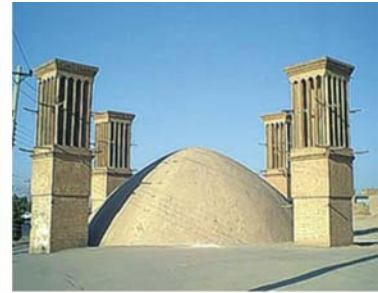
links nach rechts: Straße durch die Wüste Lut, Kalouts (Wanderung 2013), eine der zahlreichen Zisternen entlang der Seidenstraße