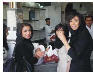
von links nach rechts: Herstellung von ungebrannten Lehmziegeln in Meybod, Djame-Moschee in Yazd, iranische Frauen in einer Bäckerei in Yazd