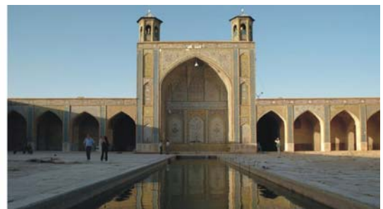
von links nach rechts: Relief in Persepolis, Arg-e Karim Khan (Stadtfestung von Shiraz), Vakil Moschee (Shiraz)