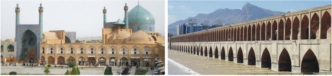
Isfahan: der große Platz mit der Imam-Mosche, Si-o Se Pol (33-Bogen-Brücke) über den Zayandeh Rud

Wasserversorgung von den Schmelzwässern des 4.075 m hohen Shir Kuh seit Jahrhunderten über Qanate von insgesamt über 300 km Länge). Die Altstadt, mit rd. 3 ha Fläche aus Lehmgebäuden mit ungebrannten Ziegeln, wurde 2007 in die UNESCO-Welterbeliste aufgenommen. Unser Hotel in einem traditionellen Haus eines sehr wohlhabenden Händlers ist Teil davon.