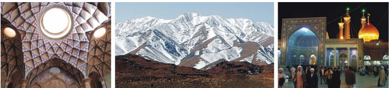
von links nach rechts: kunstvolle Kuppel in einem Händlerhaus in Kashan; Kuhrud-Gebirge bei Abyaneh; Mausoleum der Fatemeh in Qom

Zu den zahlreichen Sehenswürdigkeiten, die wir in der Altstadt auf kurzen Wegen möglichst zu Fuß ansteuern werden, um die Stadt in ihrer Gesamtheit zu erfassen, gehören: der große Platz (Meydan-e Imam) im Zentrum der safavidischen Neustadt des 17. Jahrhunderts, der mit den gigantischen Ausmaßen von 524 x 160 m und mit seinen doppelstöckigen Arkaden, die ihn umrahmen, für die Iraner der Inbegriff eines Platzes ist (UNESCO-Welterbe); Palast Ali Qapu mit Thronsaal und Privatgemächern (Residenz der Safaviden); Große Moschee (eine der schönsten Hofmoscheen der Safaviden); Bazar aus dem 16./17. Jh.; Chehel-Sotun (einer der prächtigsten Gartenpaläste); Medrese-ye Chahar Baq (letzter bedeutender Bau der Safaviden; 1722 wurde hier Shah Sultan Hossein durch die Afghanen gefangen genommen und sechs Jahre später hingerichtet); Masjed-e Djameh im Zentrum der historischen Altstadt (seit 2012 UNESCO-Welterbe); Armenierviertel Neu-Jolfa (1605 ließ Shah Abbas I rund 30.000 Armenier aus Jolfa nach Isfahan umsiedeln, als ihre Heimatstadt durch die kriegerischen Auseinandersetzungen gegen das Osmanische Reich zerstört wurde) ... und viele weitere Perlen der Architektur mit kunstvollem Fliesenschmuck.