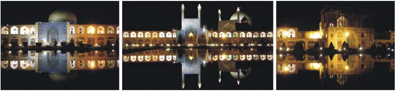
Der große Platz in Isfahan bei Nacht (von links: Masjed-e Lotfollah, Masjed-e Imam und Ali Qapu-Palast), im 17. Jh. Machtzentrum der Safaviden