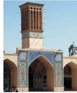
Windturm in Kerman

Iran zählt zu den sichersten Reise­ ländern überhaupt. Alle, die Iran bereits in den letzten Jahren erlebt haben, sind nicht nur von den grandiosen Landschaften und einzigartigen Monumenten begeistert, sondern gleichermaßen überrascht, dass sich unser durch Medien und Politik geprägte Bild nicht mit der erlebten Offenheit und Gastfreundschaft in Iran deckt. Unterstrichen wird dies auch durch das Auswärtige Amt der Bundesrepublik Deutschland: keine Reisewarnung.