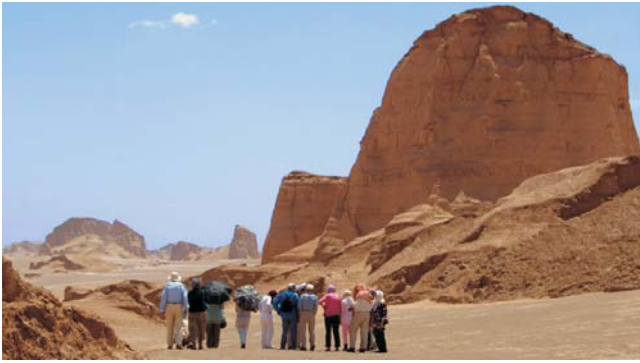
Landschaftsformung durch Wind - Wanderung in der Wüste Lut