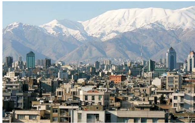
Teheran vor den schneebedeckten Gipfeln des Albus

dieser Folder wurde CO 2 -neutral hergestellt