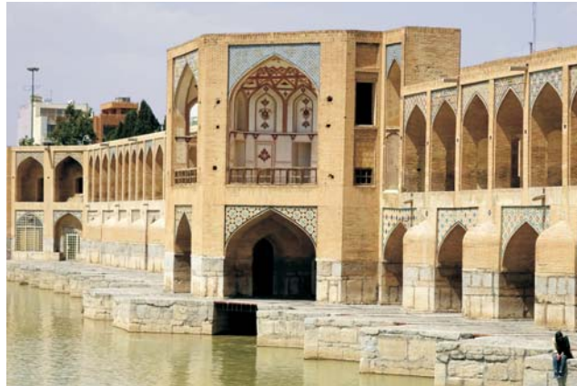
Isfahan - Pol-e Chādschu, Brücke von 1650 über den Zayandeh Rud