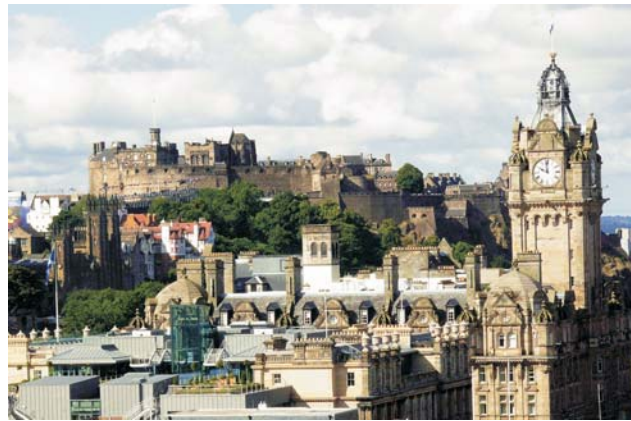
Burgberg von Edinburgh ▲ ▼ postmodernes Glasgow mit Clyde Auditorium

dieser Folder wurde CO 2 -neutral hergestellt