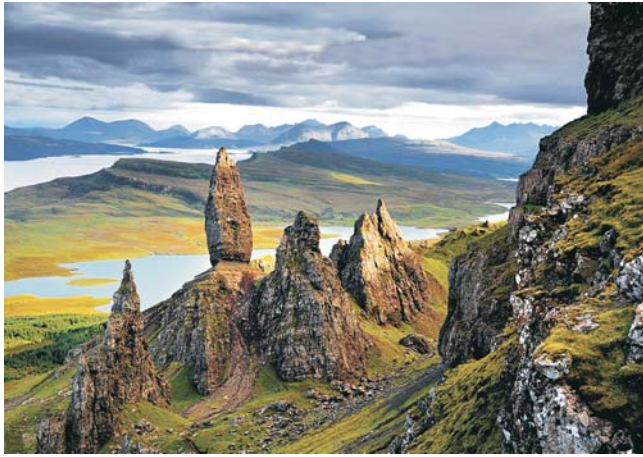
Skye - Trotternish-Halbinsel