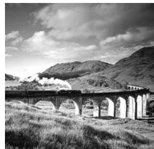
West Highland Railway