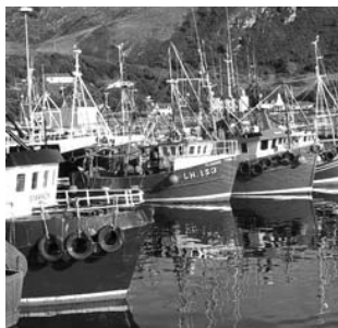
Fischerboote auf Skye

Am Anfang dieser erlebnisreichen Reise steht eine Stippvisite in Glasgow, dem modernen Herzstück Schottlands, das aus verfallener Altindustrie zur europäischen Kulturmetropole aufstieg. Ab Tag zwei, mit Basis auf der Isle of Skye, dann Schottland pur: im schottischen Nordwesten begegnen wir einer einmaligen Natur- und Kulturlandschaft. Wildromantische Lochs, majestätische Berge und malerische Burgen sind nur die bekanntesten Aspekte dieses Landes. Ausgangspunkt unserer Exkursion ist der idyllische Küstenort Portree auf der Isle of Skye (Innere Hebriden). Von hier aus erkunden wir diese urwüchsige Insel und die nahe gelegene Festlandsküste Schottlands auf Ausflügen mit dem Bus, mit dem Schiff, zu Fuß (auf mehreren, gut zu bewältigenden Wanderungen) und mit der legendären West Highland Railway auf der „schönsten Zugfahrt Großbritanniens“. Zu entdecken gibt es eine Landschaft voller Geschichten: Die geologischen Spuren der Eiszeiten und die menschlicher Eingriffe, Küsten mit üppiger, fast mediterraner Vegetation, kulturelle Zeugnisse des Freiheitskampfes eines stolzen Volkes und der modernen Entwicklungsprobleme einer am äußersten Rand Europas gelegenen Region. Zur Abrundung der Exkursion steht zum Schluß noch die stolze Hauptstadt Edinburgh auf dem Programm.