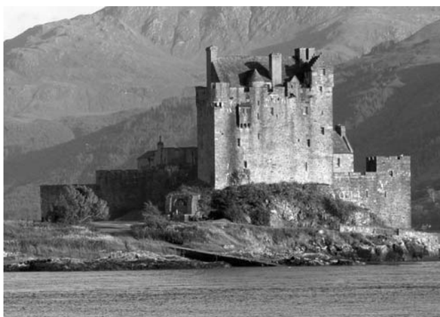
Eilean Donan Castle gegenüber Skye