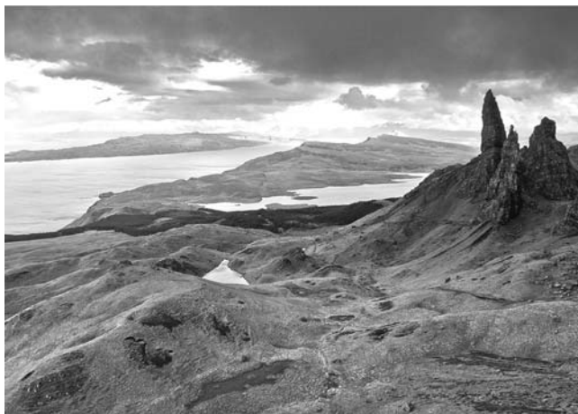
Skye - Trotternish