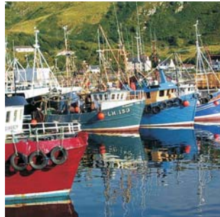
Fischerboote auf Skye

Schottland erleben! Fern der Touristenklischees von inszenierten Folkloreveranstaltungen und Nessie-Nepp führt Sie Geopuls mit dieser Studienreise in die North Western Highlands, das Land wildromantischer Lochs, majestätischer Berge und malerischer Burgen. Zu entdecken gibt es eine Landschaft voller Geschichten: Die Spuren der Eiszeiten und die menschlicher Eingriffe, Küsten mit üppiger, fast mediterraner Vegetation und menschenleere Landschaften, Zeugnisse des Freiheitskampfes eines stolzen Volkes und der modernen Entwicklungsprobleme einer am äußersten Rand Europas gelegenen Region. Neben der stolzen Hauptstadt Edinburgh werden Sie auch Glasgow besuchen, eine Stadt, die ähnlich wie Phönix aus der Asche aus verfallener Altindustrie zur modernen Metropole und europäischen Kulturhauptstadt aufstieg.