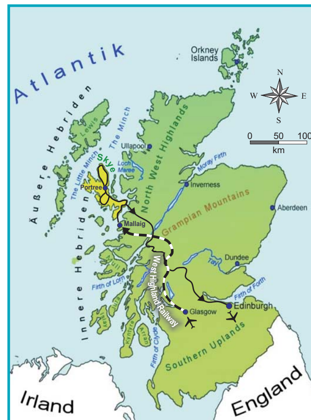
Exkursionsroute Studienreise Isle of Skye.....