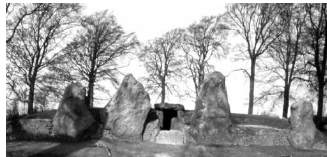
Steinzeitliche Grabanlage am Ridge Way Path, Fernverbindung seit Urzeiten

Ein weiterer Ausflug führt Sie nach Stratford-upon-Avon, der Geburts- und Wirkungsstätte von William Shakespeare. Im Norden von Oxford haben wir Gelegenheit zum Besuch des Blenheim Palace. Das grandiose Schloss war das Geschenk von Queen Ann an John Churchill, dem ersten Herzog von Marlborough, für den Sieg über die Franzosen und deren Verbündete, die Bayern, im Jahre 1704 bei Höchstädt-Blindheim. Im November 1874 wurde das Schloß zum Geburtsort eines weiteren, weit über die Grenzen Englands bekannt gewordenen Briten: Sir Winston Churchill. Auch auf diesem Ausflug runden Einblicke in die Entstehung der Natur, aus der diese Kernlandschaft Englands hervorging, das Bild ab.