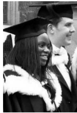
Examen in Oxford

Die Anmeldung erfolgt über Geopuls. Nach der Anmeldung wird mit der von Geopuls zugesandten Buchungsbestätigung eine Anzahlung (15 % des Exkursionspreises) fällig. Die Restzahlung erfolgt zwei Wochen vor Reisebeginn. Es gelten die Geschäftsbedingungen des Veranstalters: Geopuls GbR, Neckarhalde 62, 72108 Rottenburg (Tel. 07472-9808802). Die Allgemeinen Reisebedingungen werden gerne vorab zugeschickt. Sie können aber auch auf der Homepage www.geopuls.de eingesehen und ausgedruckt werden.