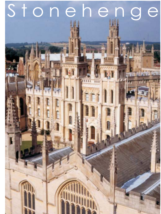
All Souls College