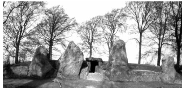
Steinzeitliche Grabanlage am Ridge Way Path, Fernverbindung seit Urzeiten

Ein weiterer Ausflug führt uns nach Stratford-upon-Avon, der Geburts- und Wirkungsstätte von William Shakespeare. Im Norden von Oxford haben wir Gelegenheit zum Besuch des Blenheim Palace. Das grandiose Schloss war das Geschenk von Queen Ann an John Churchill, dem ersten Herzog von Marlborough, für den Sieg über die Franzosen und deren Verbündete, die Bayern, im Jahre 1704 bei Höchststadt-Blindheim. Im November 1874 wurde das Schloß zum Geburtsort eines weiteren Briten: Sir Winston Churchill. Auch auf diesem Ausflug runden Einblicke in die Entstehung der Natur, aus der diese Kernlandschaft Englands hervorging, das Bild ab.