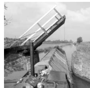
Schleuse am Oxford Canal