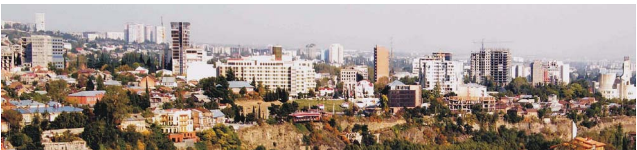
Panoramaansicht von Tiflis, Georgien