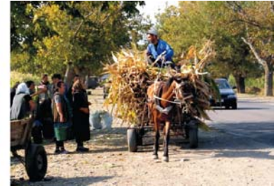
Bilder von links nach rechts: Festung Khertvisi; Blick vom Gudauri Bärenkreuzpass in das Tal des Pshavi Aragavi, Georgischer Volkswagen