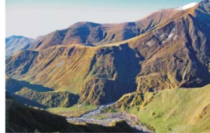
Bilder von links n. rechts: Ushguli in der Provinz Swanetien; Blick auf Mtskheta, die ehemalige Hauptstadt Georgiens, Blick in das Tal des Weißen Aragvi