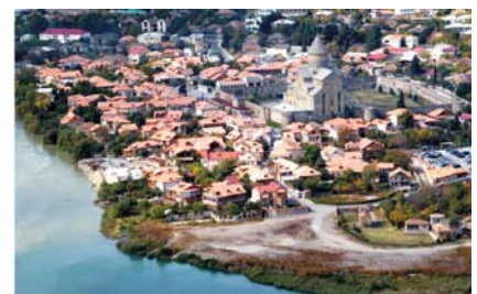
Bilder von links nach rechts: Georgische Türe; Georgs-Kloster in Alaverdi; Klosterkirche in Atenis Sioni; Mzcheta die ehemalige Hauptstadt Georgiens