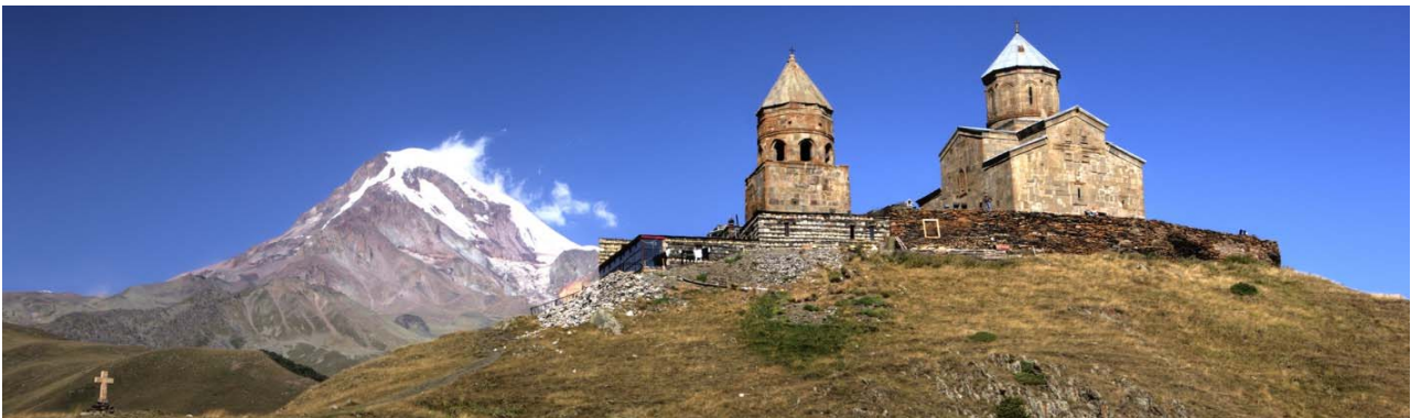
Gergeti Dreifaltigkeitskirche vor dem Berg Kasbek (5047m)

Eine landschaftlich äußerst eindrucksvolle Fahrt führt über den Kreuzpass in die Kaukasus-Hauptkette nach Kazbegi (Stepanzminda) am Fuße des erloschenen Schichtvulkans Kasbek (mit 5.047 Metern der dritthöchste Berg Georgiens). Mit Geländefahrzeugen gelangen wir von Kazbegi auf die Höhen der Gergeti Dreifaltigkeitskirche, die wir nach einem kurzen Fußweg mit schönem Blick auf die Berge und die Ortschaft Kazbegi erreichen. Bevor wir die Rückfahrt wieder über den Kreuzpass nach Gudauri antreten, geht es zurück nach Kazbegi und hinab durch die imposante Terek-Schlucht zur Baustelle des neuen Wasserkraftwerks an der georgisch-russischen Grenze. Übernachtung wie am Vortag.