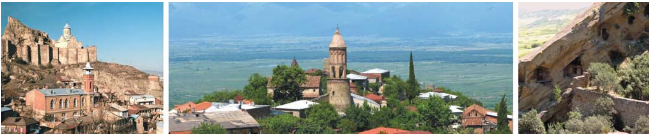
Bilder von links nach rechts: Altstadt von Tiflis; Blick auf Signagi, herrlich gelegen über dem Alazani-Tal; Mönchszellen des Lavra Klosters Dawit-Garedzha

Karawanserei, Schwatelistraße, Stadtmauer, Baratschwilistraße) und der Kolonialstadt führt die Route entlang des Rustaveli- Boulevards mit Regierungspalast und Rustavelitheater. Höhepunkt des Tages ist anschließend der Avlabari-Stadtteil (Königin-Ketewanplatz, Sameba-Komplex mit Kathedrale zur Heiligen Dreifaltigkeit). Dort klingt auch dieser interessante Tag bei einem gemütlichen Abendessen in einem traditionellen georgischen Restaurant aus. Übernachtung in Tiflis.