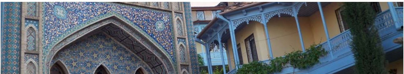
Detail im Bäderviertel von Tiflis

Flug von Stuttgart (07:20) via Istanbul (An: 11:15 Ortszeit) nach Tiflis (Ab 13:10, An 16:30). Erste Eindrücke von Tiflis.