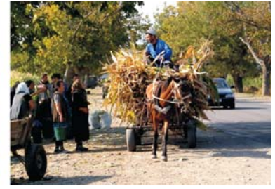
Bilder von links nach rechts: Festung Khertvisi; Blick vom Gudauri Bärenkreuzpass in das Tal des Pshavi Aragavi, Georgischer Volkswagen