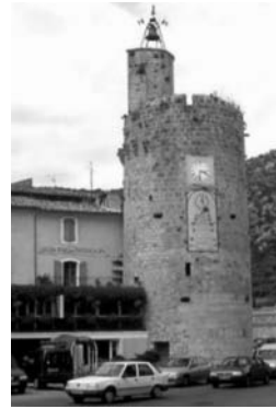
Anduze: Tour de l'Horloge

Die Reformation stieß in Frankreich auf heftigen Widerstand der katholischen Krone. Am 24.8.1572 verloren über 12.000 Hugenotten (franz.: Camisardes) ihr Leben. Die Cevennen mit Anduze wurden zum Schauplatz eines lang anhaltenden Widerstandes, der die Kultur der Region bis heute prägt.