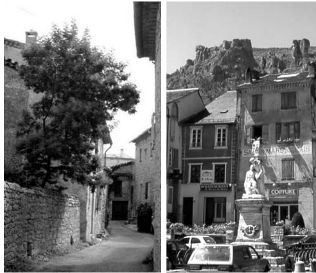
Gasse in Tornac