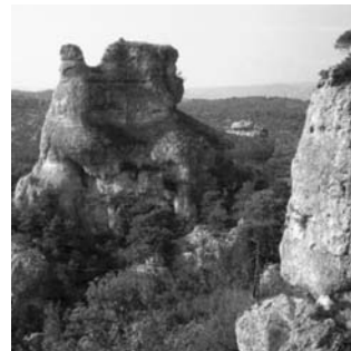
Karstlandschaft Montpellier le Vieux auf dem Causse Noir und majestätischer Gänsegeier über dem Gorges de la Jonte

Die Grundmauern unseres frisch renovierten Quartiers im ruhigen Tornac gehen auf das 11. Jh. zurück. Dort werden wir jeden Abend von unserem Hausherrn mit einem dreigängigen Menü verwöhnt. Der geräumige Wohnraum mit offenem Kamin sowie die große Terrasse mit herrlicher Aussicht bieten ideale Kulissen für gemütliche Abende.