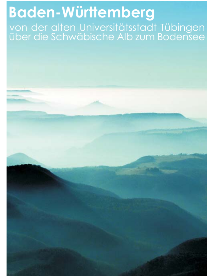
UNESCO-Biosphärenreservat Schwäbische Alb

von der alten Universitätsstadt Tübingen über die Schwäbische Alb zum Bodensee