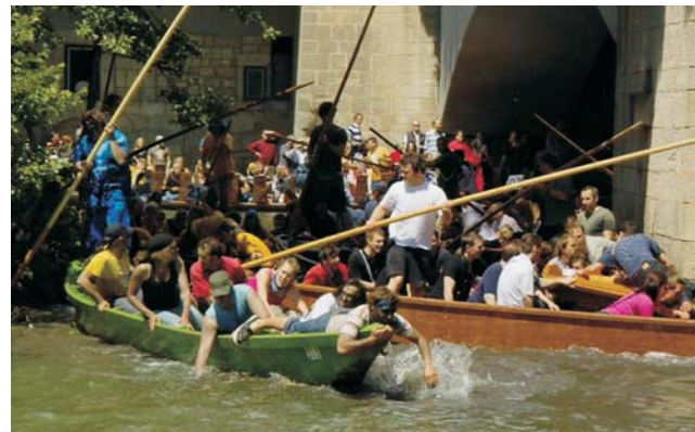
beim tübinger Stochekahnrennen brodelt der Neckar - jedes Jahr im Sommer

Mit fast südländischem Flair begrüßt der Bodensee seine Gäste. Die Sonnenhänge sind Standort für Obst- und Weinbaukulturen, und bieten phantastische Ausblicke auf die Alpen in der gegenüber liegenden Schweiz. Auf den Spuren von Albrecht Penck bewegen wir uns durch die gesamte glaziale Serie, von den Endmoränen im Einzugsgebiet der Donau bis zu den großen Zungenbecken, u.a. mit dem Wurzacher Ried, einer der bedeutendsten Hochmoore Mitteleuropas.