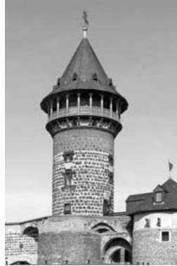
Ulrepforte, Teil der mittelalterlichen Stadtbefestigung

In über 2000 Jahren wechselvoller Geschichte hat die Stadt am Rhein vieles erlebt, wovon ihre Mauern und so manche Kuriosität erzählen: Anfängen von den Zeugen aus römischer Zeit, über monumentale Bauten aus ihrer Blütezeit im Mittelalter bis hin zum absoluten Tiefpunkt, dem 2. Weltkrieg.