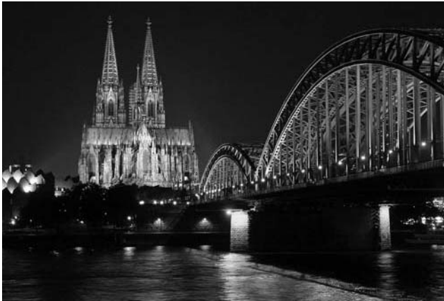
Stadtpanorama mit Dom, Museum Ludwig und Hohenzollernbrücke