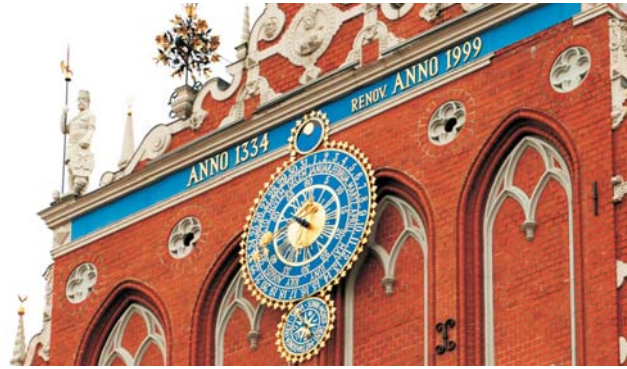
Riga: astronomischer Taktgeber am Schwarzhäupterhaus