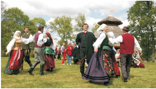
lebendige Traditionen in Litauen