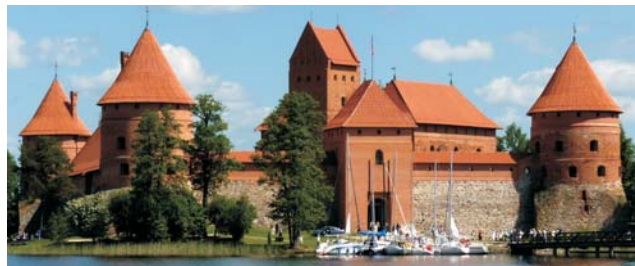
Trakai: bis 1323 Hauptstadt von Litauen

Die waldreichen und von Dünen und Moränen der letzten Eiszeit geprägten, äußerst reizvollen, seenreichen Landschaften sind recht dünn besiedelt. Hier trifft der Reisende auf trutzige Burgen, prächtige Schlösser und idyllische Dörfer. Die glanzvollen Städte hingegen, die auf Jahrhunderte abwechslungsreicher Geschichte zurück blicken, waren bedeutende Handelsstädte der einst mächtigen Hanse. Mit sehr unterschiedlichen Sprachen haben beide Länder bis heute ihre eigenen Wurzeln und Identität bewahrt. Während Lettland, einst Teil des Deutschen Ordens, der Reformation zusprach, blieb Litauen katholisch. Seit ihrer erneuten Unabhängigkeit 1990/91 und dem EU-Beitritt 2004 haben beide Staaten eine beachtenswerte Entwicklung vollzogen, die sich vor allem im Straßenbild der Städte widerspiegelt. Unsere Route umfasst beides: die größeren Städte wie Vilnius, Kaunas, Klaipeda (Memel) und Riga, verläuft aber ebenso durch die beschaulichen ländlichen Regionen (z.B. nördlich von Vilnius nach Oberlitauen, Trakai - der mittelalterlichen Festung und ehemaligen Hauptstadt, Rumsiskes, Ostseebad Polanga, Krimulda, Turaida, Sigulda) und zu den wunderschönen Landschaften beider Länder (z.B. Kurische Nehrung mit ihren großen Dünen, Ostseestrand mit dem Landhaus von Thomas Mann, Gaujas Nationalpark mit seinem imposanten Urstromtal); darunter befinden sich drei UNESCO-Welterbestätten.