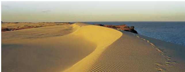
Dünen auf der Kurischen Nehrung, Litauen

Nach der Anmeldung zu dieser Exkursion wird mit der von GEOPULS zugesandten Buchungsbestätigung eine Anzahlung (15 % des Reisepreises) fällig. Die Restzahlung erfolgt zwei Wochen vor Reisebeginn. Es gelten die Geschäftsbedingungen des Veranstalters: Geopuls-Studienreisen, Neckarhalde 62, 72108 Rottenburg a.N. (Tel. 07472-9808802). Die Allgemeinen Reisebedingungen werden gerne vorab zugeschickt oder können auf/von der Geopuls-Homepage www.geopuls.de eingesehen oder ausgedruckt werden.