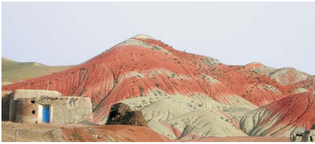
Vulkanische Ablagerungen südöstlich des Saband