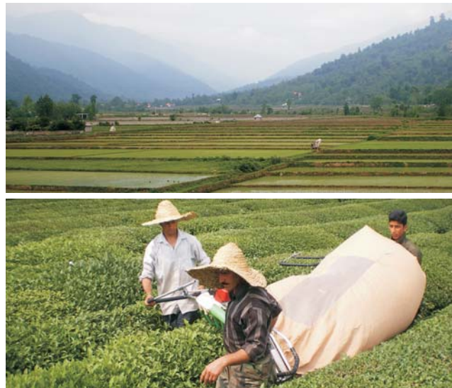
Reisanbau (oben) und Teeplantagen (unten; Ernte) bei Fuman

dieser Folder wurde CO 2 -neutral hergestellt