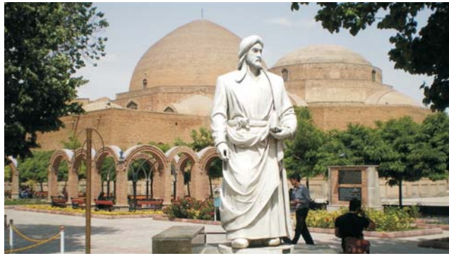
Blaue Moschee und Denkmal für den Dichter Chaqani in Tabriz

Nach der Anmeldung zu dieser Exkursion wird mit der von GEOPULS zugesandten Buchungsbestätigung eine Anzahlung (15 % des Reisepreises) fällig. Die Restzahlung erfolgt zwei Wochen vor Reisebeginn. Es gelten die Geschäftsbedingungen des Veranstalters: Geopuls-Studienreisen, Neckarhalde 62, 72108 Rottenburg a.N. (Tel. 07472-9808802). Die Allgemeinen Reisebedingungen werden gerne vorab zugeschickt. Sie können bei der VHS eingesehen, oder auch von der Homepage www.geopuls.de ausgedruckt werden.