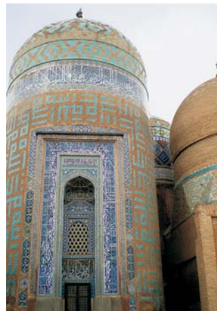
Grabturm (14. Jh.) in Ardabil

Packende Rundreise durch eine wenig bekannte Region: Schon in der Antike war Aserbaidschan Teil des persischen Reiches. Zu Beginn des 16. Jahrhunderts wurde in Tabriz, damals Hauptstadt von Iran, Ismail I zum Shah gekrönt. Erst durch die russische Eroberung im 19. Jahrhundert wurde Aserbaidschan geteilt. Der Norden ist seit 1991 eine unabhängige Republik, während die Mehrheit der Azeri in ihren alten Stammländern auf iranischer Seite lebt. Hier warten auf den Besucher nicht nur die ältesten aserbaidschanischen Kulturgüter, sondern auch eine faszinierende Landschaft die ihresgleichen sucht - vom salzreichen Orumiyeh-See, über junge Vulkanlandschaften und trockene Steppen, bis zum 4000 m hohen Alborz. Größer können Gegensätze kaum sein: nach Überquerung des mächtigen Alborz-Gebirges ändert sich schlagartig das Klima. In der subtropischen Provinz Gilan am Kaspischen Meer erwarten üppige Bergwälder, ausgedehnte Reisfelder und grüne Tee-Plantagen den Reisenden. Auf der gesamten Reiseroute, die auch durch die Provinzen Hamadan und Kordestan führt, stehen nicht weniger als 4 UNESCO-Welterstätten auf dem Programm: der Feuertempel Takt-e Soleyman, der auf die Mongolen zurückgehende Kuppelbau von Soltaniyeh (höchste gemauerte Kuppel der Welt), der Bazar von Tabriz und das Mausoleum von Sheikh Safi in Ardabil. Das pittoreske Dorf Masuleh ist Anwärter, demnächst ebenfalls in diese Liste aufgenommen zu werden.