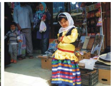
von links nach rechts: die höchste gemauerte Kuppel der Welt in Soltaniyeh, Reisfelder bei Fuman, Mädchen in Masuleh (Provinz Gilan)

Hamadan und Kordestan: Auch die Region südlich der aserbaidshanischen Provinzen Irans hat kulturell und landschaftlich dem Reisenden einiges zu bieten. Durch den Nordteil des Zagros-Gebirges führt unsere Route über Hamadan und durch den östlichen Teil von Kordestan. Nicht nur erdgeschichtlich (z.B. Höhle von Ali Sadre), sondern auch kulturell führt die Route weit in die Vergangenheit. Hamadan (griech. Ekbatana ), vor 2700 Jahren Hauptstadt der Meder, war lange Zeit eine der wichtigsten Städte Irans. Über das kurdische Bergland erreichen wir Takt-e Soleyman, einen Feuertempel der Sasaniden aus dem 5.-6. Jh.