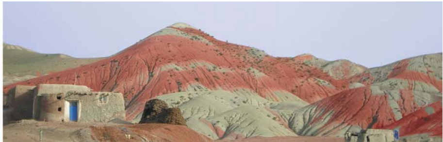
von links nach rechts: turkstämmige Azeri, Vulkanlandschaft im Hochland von Azarbayjan