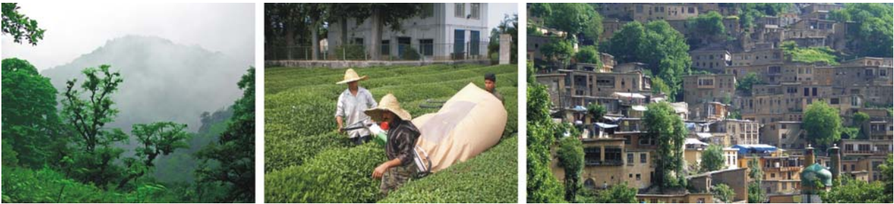
von links nach rechts: Kaspischer Bergwald, Tee-Plantage bei Fuman, Masuleh an den Hängen des Alborz-Gebirges

(Übernachtungen: 2 x bei Fuman, 1 x in Tehran – Hotels s.u.)