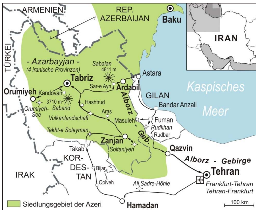
Reiseziele und -route im Überblick