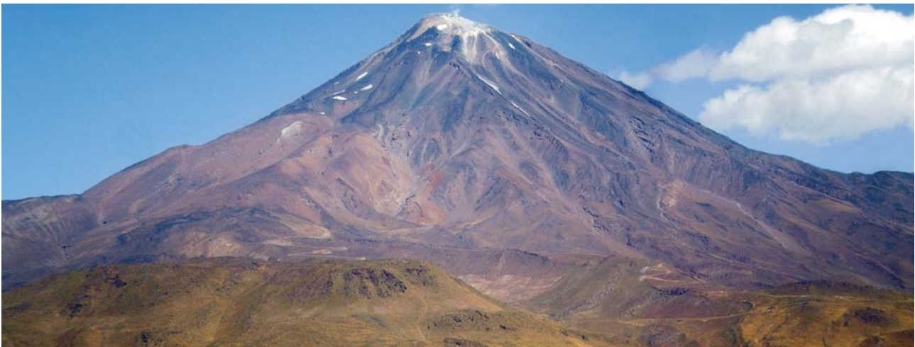
Damavand: mit 5.671 m Höhe der höchste Berg Irans

Preis pro Person im DZ: 240,- € (EZ- Zuschlag: 60,- €)