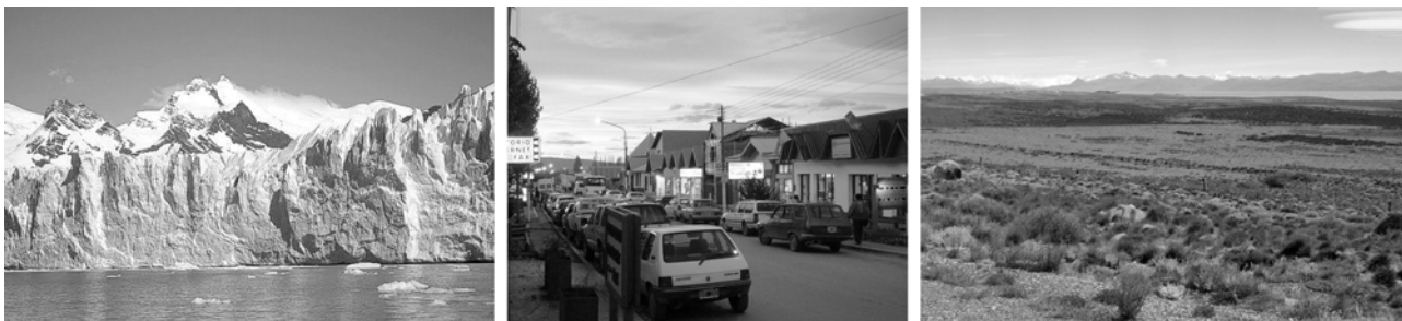
Gletscher Perito Moreno, El Calafate - Ausgangsort unserer Tagesexkursionen in Patagonien, Steppenlandschaft Patagoniens

Unterkunft: ***Hotel Shehuen in El Calafate (3 Übernachtungen)