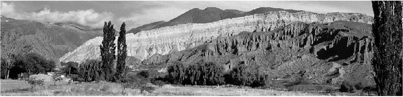
Quebrada de Humahuaca

Farbenspiel, verursacht durch unterschiedliche Gesteine und Mineralzusammensetzungen, bietet Besuchern einen unvergesslichen Eindruck zur Gebirgsbildung der Anden und zieht Jahr für Jahr viele Gäste an. Von Purmamarca aus gelangt man auf die Nationalstraße 9, die sich entlang der Schlucht Quebrada de Humahuaca schlängelt. Diese Schlucht wurde, und wird noch immer, vom Río Grande tief eingeschnitten, denn die Gebirgsbildung der Anden hat noch nicht ihren Abschluss erreicht. Die markante und beeindruckende Schlucht ist damit eine typische Landschaftsform der Vorpuna – jener Gebirgskette, die an den mächtigen Hochgebirgsblock des nördlichen Andenabschnitts, der Puna, angrenzt. Die Vorpuna wurde im Jungtertiär, d.h. erst seit den letzten 5 Millionen Jahren stark gefaltet und empor gepresst und ist damit, zumindest geologisch gesehen, ein äußerst junges Gebirge. Dabei bildeten sich, bedingt durch die starke Hebung, zwischen den einzelnen Gebirgszügen tiefe Täler heraus die bis heute von den Flüssen stark zerklüftet werden. Wegen ihrer Einmaligkeit wurde die Humahuaca-Schlucht 2003 zum UNESCO-Welterbe erklärt.