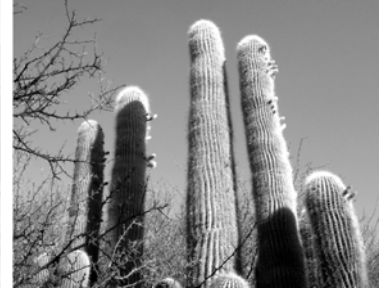
Kolonialstadt Salta mit neoklassizistischer Kathedrale, Gebirgsketten der Anden (Puna), Kandelaber-Kakteen