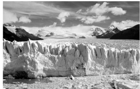
Iguazú-Wasserfälle, Plaza Dorrego im Künstlerviertel San Telmo / Buenos Aires, Gletscher Perito Moreno / Patagonien