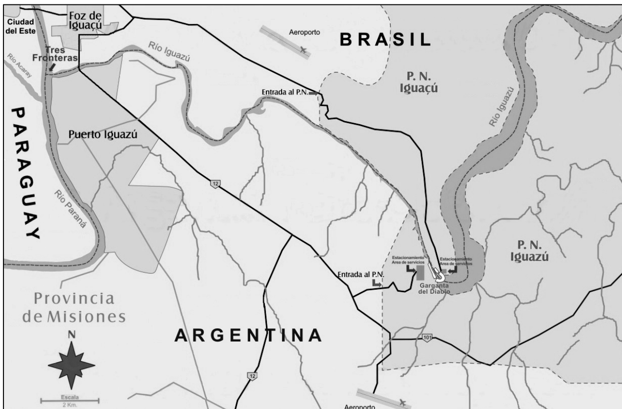
Übersichtskarte der Iguazú-Region

Nach einer Erfrischungspause im Hotel werden wir am Nachmittag einen ersten Eindruck von den Wasserfällen gewinnen. Wir überqueren erneut die Grenze und besuchen den brasilianischen Teil des Nationalparks; der größte Wasserfall Iguazús, die Garganta del Diablo (Teufelsrachen), ist von Brasilien aus am Besten zu bestaunen – der tobenden Wassermassen stürzen an die 80 Meter in die Tiefe. Am 3. Exkursionstag widmen wir uns der argentinischen Seite der Wasserfälle. Verschiedene Wege führen uns dabei immer wieder zu den Katarakten. Mit einem Ökologischen Zug, der mit Gas angetrieben wird, fahren wir eine kurze Strecke in die Nähe des Teufelsrachens. Ein Spaziergang am Nachmittag führt uns durch die beeindruckende Vielfalt von Flora und Fauna des subtropischen Regenwalds.