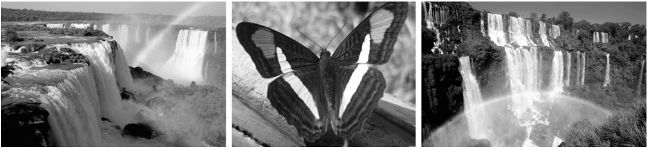
Impressionen von den Iguazú-Wasserfällen