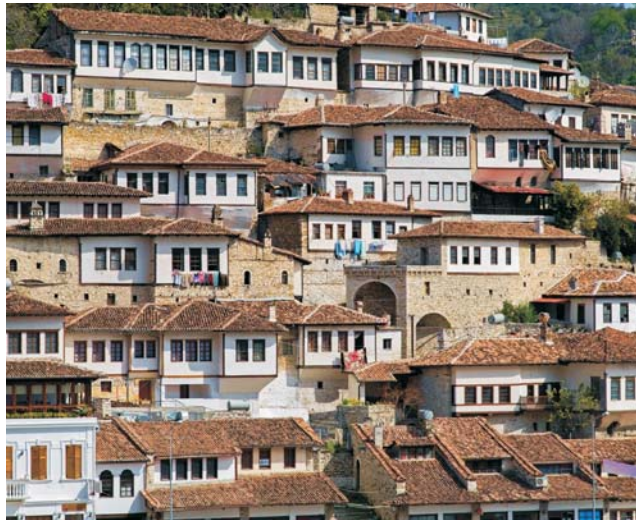
eng an die Felsen geschmiegte Altstadt von Berat