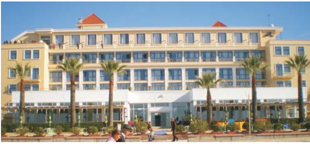
Unsere Unterkunft am Strand von Durres: Hotel Adriatik