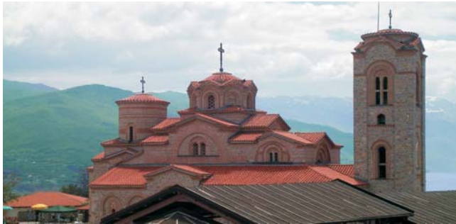
Kloster Sveti Naum (9. Jh.) am Ohridsee / UNESCO-Welterbe

Nach der Anmeldung zu dieser Exkursion wird mit der von GEOPULS zugesandten Buchungsbestätigung eine Anzahlung (15 % des Reisepreises) fällig. Die Restzahlung erfolgt zwei Wochen vor Reisebeginn. Es gelten die Geschäftsbedingungen des Veranstalters: Geopuls GbR, Neckarhalde 62, 72108 Rottenburg (Tel. 07472-9808802). Bitte beachten Sie vor Reisebuchung unsere Allgemeinen Reisebedingungen sowie das Formblatt zur Unterrichtung des Reisenden bei einer Pauschalreise nach § 651a des BGB (EU-Richtlinie 2015/2302). Beides schicken wir vor Buchung gerne zu, oder kann auf/von der Webseite www.geopuls.de eingesehen und ausgedruckt werden.