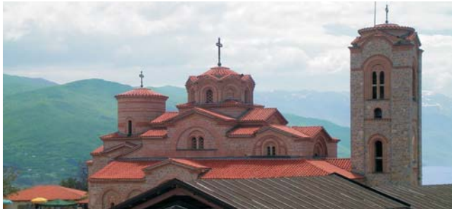
Kloster Sveti Naum (9. Jh.) am Ohridsee / UNESCO-Welterbe

Nach der Anmeldung zu dieser Exkursion wird mit der von GEOPULS zugesandten Buchungsbestätigung eine Anzahlung (15 % des Reisepreises) fällig. Die Restzahlung erfolgt zwei Wochen vor Reisebeginn. Es gelten die Geschäftsbedingungen des Veranstalters: Geopuls GbR, Neckarhalde 62, 72108 Rottenburg (Tel. 07472-9808802). Bitte beachten Sie vor Reisebuchung unsere Allgemeinen Reisebedingungen sowie das Formblatt zur Unterrichtung des Reisenden bei einer Pauschalreise nach § 651a des BGB (EU-Richtlinie 2015/2302). Beides schicken wir vor Buchung gerne zu, oder kann auf/von der Webseite www.geopuls.de eingesehen und ausgedruckt werden.