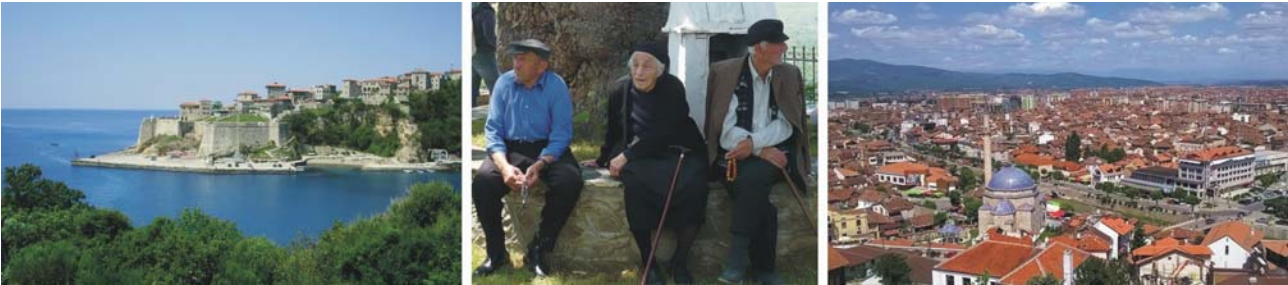
von links nach rechts: Ulcinj (Montenegro), Dorfleben, Prizren (Kosovo)

Unterkünfte: *** Hotel Čile in Kolašin / Montenegro (oder vergleichbar) *** Hotel Shkelzeni in Bajram Curri / Albanien (oder vergleichbar)