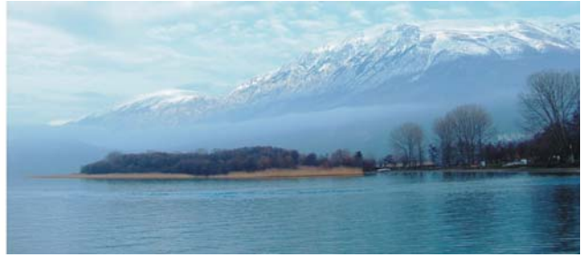
Festung von Ohrid und Winterstimmung am Ohrid-See

Besichtigungen der Altstadt von Ohrid (UNESCO-Welterbe) geplant, die mehreren großartigen Kulturen zu verdanken ist. Ohrid gilt als Perle unter den mazedonischen Städten. Bulgaren, Osmanen und Serben lebten hier Tür an Tür und regelten ihre Rechte als Minderheiten vertraglich - auf dem Balkan eher eine Seltenheit. Nach der illyrischen Stadtgründung im 8. Jh. v. Chr. geriet die Region zunächst unter makedonische, griechische und römische, im Mittelalter unter bulgarische und schließlich osmanische Herrschaft. Durch die Balkankriege vorübergehend serbisch, im 2. Weltkrieg wieder bulgarisch, danach jugoslawisch, ließen Ohrid auch im 20. Jh. bewegte Zeiten erleben. Seit 2005 erlebt die Stadt durch den Tourismus einen wirtschaftlichen Aufschwung (Abendessen und Übernachtung in Ohrid).