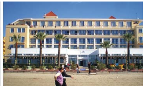
links nach rechts: Sv. Naum am Ohrid-See / Mazedonien, Via Egnatia in Elbasan, Hotel Adriatik an der Adria in Durres