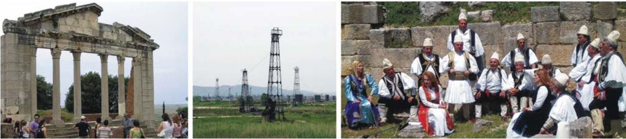
von links nach rechts: Ausgrabungsort Apollonia und Erdölfeld bei Fier, Folklore im römischen Theater von Bylis

Unterkünfte: **** Hotel Brillant in Saranda / Albanien (oder vergleichbar) *** Hotel Alvero in Permet / Albanien (oder vergleichbar) *** Pension Vila Falo in Voskopja / Albanien (oder vergleichbar)