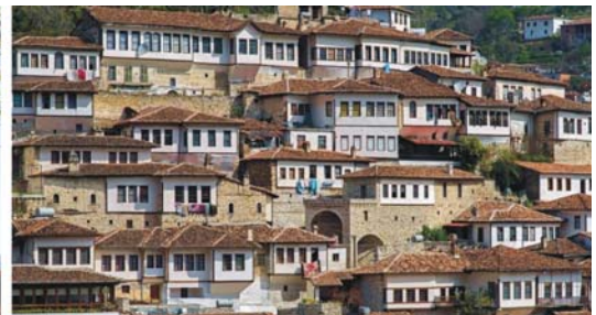
von links nach rechts: ausrangierte Diktatoren in einem Hinterhof, Moschee in Kruja, eng an den Berg geschmiegte Altstadt von Berat