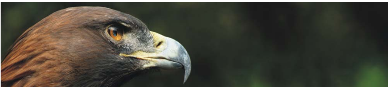
das albanische Wappentier: der Steinadler ( Aquila chryaetos )

Am Mittag Transfer zum Flughafen Tirana und Rückflug nach Frankfurt mit Lufthansa, Flug LH 1425, 13:40-16:00 Uhr und Rückfahrt mit dem Zug zum Heimatort (bei Zubuchung von Rail&Fly).