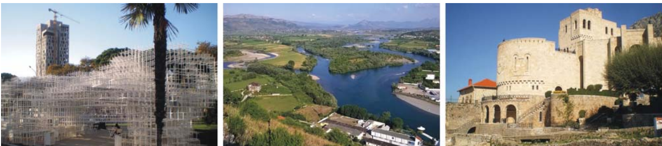
von links nach rechts: moderne Kunst im Zentrum von Tirana, Landschaft östlich des Skutari-Sees, Skanderbeu-Museum in Kruja

Tirana hat in den letzten 25 Jahren eine sehr dynamische Stadtentwicklung erfahren. Die einst düstere Stadt der kommunistischen Diktatur ist heute eine quirlig-bunte internationale Metropole. Mit jährlichen Zuwachsraten von 5 bis 7% ist Tirana weltweit eine der am schnellsten wachsenden Städte. Jüngere Schätzungen tendieren zu etwa 900.000 Einwohnern gegenüber knapp 250.000 am Ende der sozialistischen Epoche. Insofern hat sich die Unterentwicklung von einst in kürzester Zeit in eine regelrechte Hyperurbanisierung gewandelt. Auf dem Spaziergang durch die Innenstadt erleben auf nur kurzer Distanz eine eindrucksvolle Kombination aus Relikten der Vergangenheit und moderner Stadtentwicklung. Eine äußerst interessante Stellung nimmt dabei das Stadtviertel Bloku ein: aus den Straßen in denen einst, vom Volk hermetisch abgeriegelt, die berüchtigten Apparatschiki der kommunistischen Partei lebten, sind heute beliebte und teure Flaniermeilen geworden, die für jeden zugänglich sind. Nach jeweils nur kurzer Entfernung erreichen wir den Skanderbegplatz (direkt vor dem Hotel), die osmanische Et'hem-Bey-Moschee, das Nationaltheater, rechts und links des breit angelegten Bulevardi Dësmorët e Kombit die Regierungsgebäude und die Pyramide aus der Hoxha-Zeit sowie die neue orthodoxe Kirche.