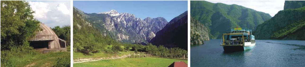
links nach rechts: im gesamten Land allgegenwärtig - Bunker aus der Zeit der Diktatur, ruhiges Tag in den Albanischen Alpen, Fähre auf der Drin

Unterkünfte: ****Hotel Centrum in Prizren / Kosovo (oder vergleichbar) ***Hotel Mangalemi (oder ****Hotel Grand White City) in Berat / Albanien