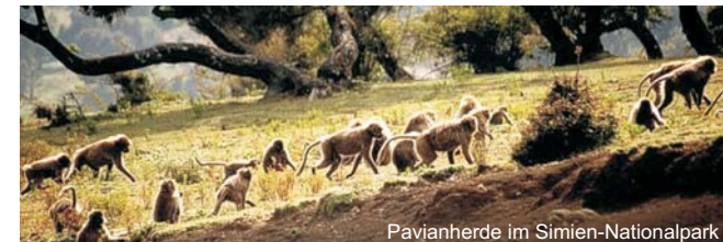
Pavianherde im Simien-Nationalpark