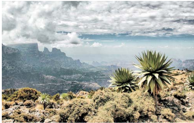
typische Lobeliengewächse der äthiopischen Höhenstufe, Simien Mountains

dieser Folder wurde CO 2 -neutral hergestellt