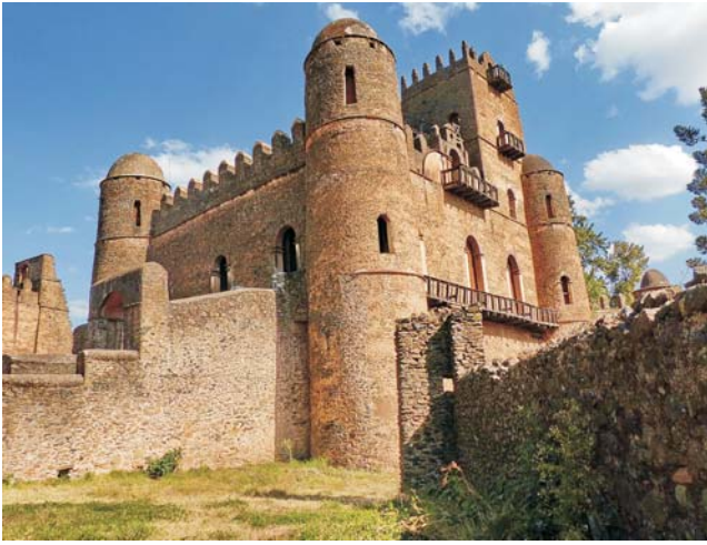
Palast des Fasilidas in Gondar