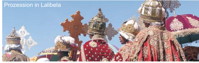
Prozession in Lalibela

Als eines der geheimnisvollsten Länder Afrikas brilliert Äthiopien, das Dach von Afrika, nicht nur mit einer atemberaubend, bizarren und abwechslungsreichen Hochgebirgslandschaft um den Tana-See, den Quellflüssen des Blauen Nils, oder den Bale Mountains, sondern ebenso mit seinen zahlreichen Kulturrelikten aus vorchristlicher und christlicher Zeit. Schrift, Sprache, Musik und Malerei sind bis heute lebendige Zeugen einer Jahrtausende alten Zivilisation, die uns in steinernen Relikten, als gewaltige Felsenkirchen, eindrucksvollen Palästen und trutzigen Burgen, überall im Land entgegengetreten. Ausgedehnte Vulkanplateaus, durchschnitten von tiefen Schluchten mit wassereichen Flüssen und rauschenden Wasserfällen, bilden das Rückgrad eines weitgehend von Agrarkulturen und Viehzucht geprägten Landes, dessen tief religiöse Bevölkerung ihr Schicksal, nicht zu den Reichen dieser Erde zu zählen, mit bewundernswerter Würde trägt. Nach Äthiopien zu reisen ist daher nicht nur ein äußerst abwechslungsreiches und faszinierendes Kultur- und Landschaftserlebnis, eine Reise dort hin bedeutet auch, die Lebensbedingungen der einheimischen Bevölkerung kennen und achten zu lernen.