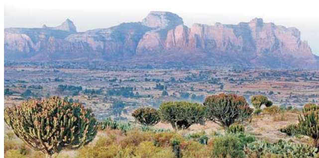
Hawzen, Gheralta Mountains mit Kandelaber-Euphorbien

GEOPULS als Veranstalter für alle am Reisen interessierten Menschen wurde 2004 von Dozenten des Geographischen Instituts in Tübingen gegründet und arbeitet seitdem mit der vhs zusammen. Begeisterte Geographen und Landeskundler, die Natur, Kultur und Hintergründe eines Ziellandes bestens vermitteln können, führen Sie bei diesen Exkursionen. Wir versuchen dabei, ein Land möglichst umfassend zu bereisen, was bedeutet, dass neben den berühmten Sehenswürdigkeiten auch die Landesnatur Beachtung und Erklärung findet. Kleine Wanderungen und Spaziergänge in die Natur bieten deshalb immer wieder eine schöne und interessante Abwechslung zum Kulturprogramm. Nicht zuletzt gilt es, ein Land so authentisch wie möglich zu erfahren und dabei auch die oft übersehenen kleinen Dinge zu entdecken. Dies funktioniert bei dieser Exkursion am besten in einer überschaubaren Gruppe von nicht mehr als 18 Teilnehmern.