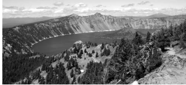
Insel im Vulkankrater - Wizard Island im Crater Lake National Park, Oregon

Go West - Oregon, Washington State (USA) und Vancouver (Kanada)