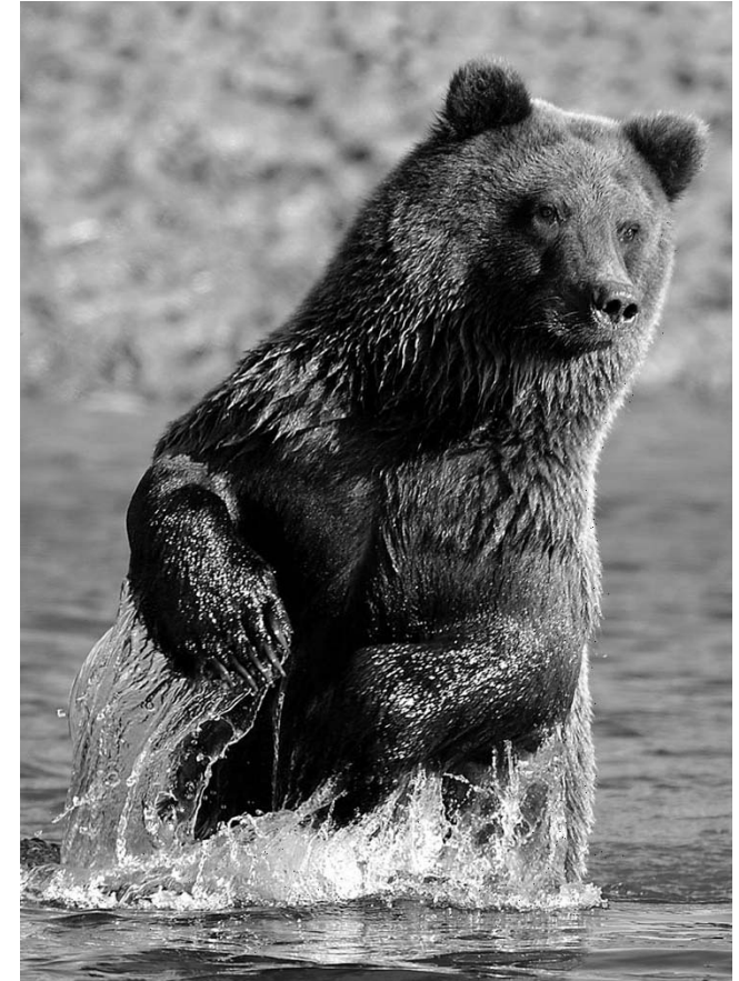
Bär beim Lachsfang