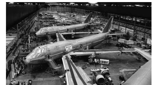
Seattle: Besuch bei Boeing