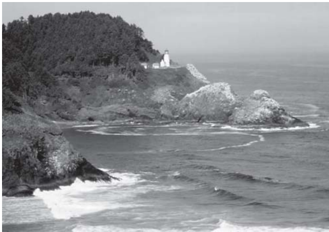
Oregons rauhe Pazifikküste