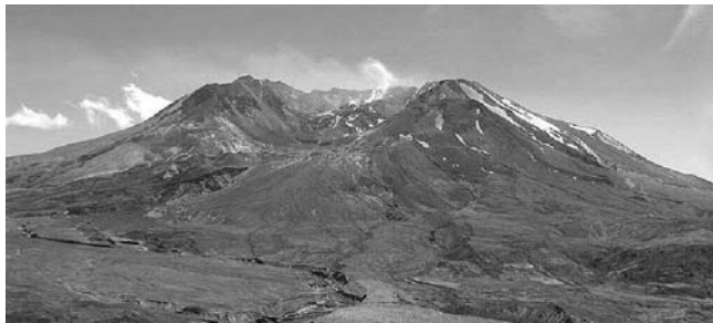
Mount St. Helens