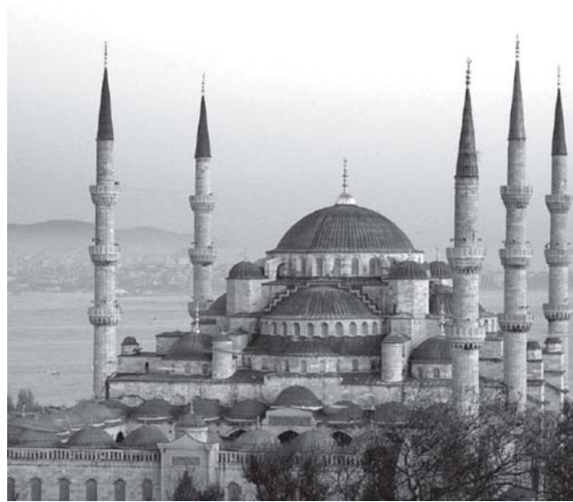
Istanbul: Blaue Moschee und Bosphorus

GEOPULS wurde im Jahr 2004 von Tübinger Geographie-Dozenten gegründet, mit dem Ziel, länderkundliche Exkursionen interessierten, reisefreudigen Menschen außerhalb der Universität anzubieten und beliebte Reiseziele einmal anders zu erleben. Dabei geht es keineswegs akademisch zu, sondern mit Geographen unterwegs zu sein bedeutet Menschen, Kultur, Kunst und Geschichte fremder Länder und Regionen mit Blick hinter die Kulissen kennen zu lernen. Die Landesnatur nimmt dabei breiten Raum ein. Bei allen Zielen stehen deshalb auch immer Themen zu Geologie, Klima, Vegetation und Landschaft auf dem Programm. Ausflüge und kleine Wanderungen in die Natur führen im Wechsel mit dem Kulturprogramm erst zu einem ganzheitlichen Erleben und Genießen. Dabei reisen Sie von Anfang an in einer kleinen, gemütlichen Gruppe Gleichgesinnter, persönlich geführt von einem landeskundigen Geographen. Das alles zum fairen Komplettpreis und ohne fakultative Zwänge. Geopuls arbeitet dabei von Anfang an eng mit verschiedenen Volkshochschulen in der Region zusammen.