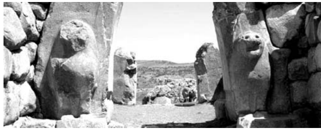
Löwentor in der Hethiter-Hauptstadt Hattussa (UNESCO-Weltkulturerbe)

Nach der Anmeldung zu dieser Exkursion wird mit der von GEOPULS zugesandten Buchungsbestätigung eine Anzahlung (15 % des Reisepreises) fällig. Die Restzahlung erfolgt zwei Wochen vor Reisebeginn. Es gelten die Geschäftsbedingungen des Veranstalters: Geopuls-Studienreisen, Neckarhalde 62, 72108 Rottenburg a.N. (Tel. 07472-9808802). Die Allgemeinen Reisebedingungen werden gerne vorab zugeschickt. Sie können bei der VHS eingesehen, oder auch von der Homepage www.geopuls.de ausgedruckt werden.