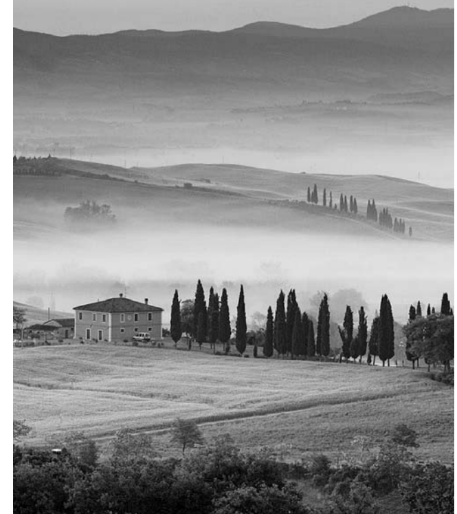
Inbegriff der Toskana: weich fließende Landschaftskonturen in mystischem Licht

Die "erschütterndste Landschaft der Welt" (F. Braudel) authentisch erleben