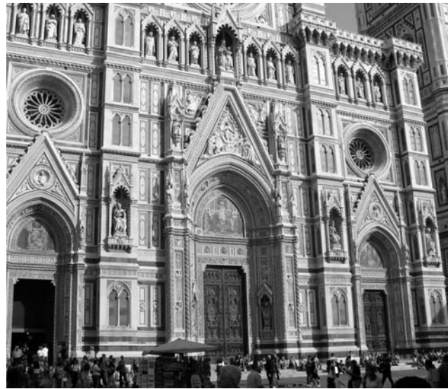
Portal des Florenzer Doms

GEOPULS wurde im Jahr 2004 von Tübinger Geographie-Dozenten gegründet, mit dem Ziel, länderkundliche Exkursionen interessierten, reisefreudigen Menschen außerhalb der Universität anzubieten und beliebte Reiseziele einmal anders zu erleben. Dabei geht es keineswegs akademisch zu, sondern mit Geographen unterwegs zu sein bedeutet Menschen, Kultur, Kunst und Geschichte fremder Länder und Regionen mit Blick hinter die Kulissen kennen zu lernen. Die Landesnatur nimmt dabei breiten Raum ein. Bei allen Zielen stehen deshalb auch immer Themen zu Geologie, Klima, Vegetation und Landschaft auf dem Programm. Ausflüge und kleine Wanderungen in die Natur führen im Wechsel mit dem Kulturprogramm erst zu einem ganzheitlichen Erleben und Genießen. Dabei reisen Sie von Anfang an in einer kleinen, gemütlichen Gruppe Gleichgesinnter, persönlich geführt von einem landeskundigen Geographen. Das alles zum fairen Komplettpreis und ohne fakultative Zwänge. Geopuls arbeitet dabei von Anfang an eng mit verschiedenen Volkshochschulen in der Region zusammen.