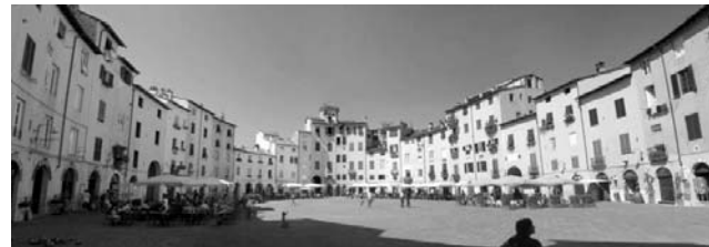
Lucca: die ovale Piazza Anfiteatro zeichnet den Grundriss des einstigen römischen Amphitheaters nach.