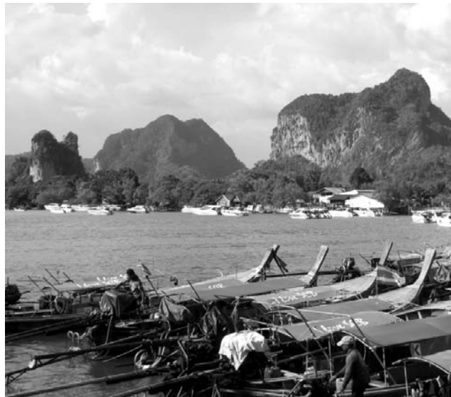
Landschaftselemente in Süd-Thailand: Karst, Mangroven und Meer

GEOPULS wurde im Jahr 2004 von Tübinger Geographie-Dozenten gegründet, mit dem Ziel, länderkundliche Exkursionen interessierten, reisefreudigen Menschen außerhalb der Universität anzubieten und beliebte Reiseziele einmal anders zu erleben. Dabei geht es keineswegs akademisch zu, sondern mit Geographen unterwegs zu sein bedeutet Menschen, Kultur, Kunst und Geschichte fremder Länder und Regionen mit Blick hinter die Kulissen kennen zu lernen. Die Landesnatur nimmt dabei breiten Raum ein. Bei allen Zielen stehen deshalb auch immer Themen zu Geologie, Klima, Vegetation und Landschaft auf dem Programm. Ausflüge und kleine Wanderungen in die Natur führen im Wechsel mit dem Kulturprogramm erst zu einem ganzheitlichen Erleben und Genießen. Dabei reisen Sie von Anfang an in einer kleinen, gemütlichen Gruppe Gleichgesinnter, persönlich geführt von einem landeskundigen Geographen. Das alles zum fairen Komplettpreis und ohne fakultative Zwänge. Geopuls arbeitet dabei von Anfang an eng mit verschiedenen Volkshochschulen in der Region zusammen.