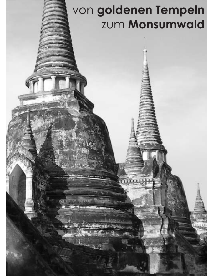
Ayutthaya: Pagoden des Wat Phra Si Sanphet