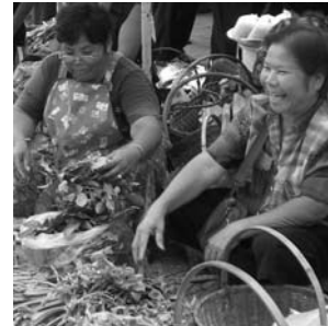
Marktszene in Khon Kaen

Das Programm ist exklusiv für eine Gruppe von 9 bis maximal 16 Personen zugeschnitten. Auf der gesamten Reise werden Sie von einem erfahrenen Landeskenner begleitet, der die Fähigkeit besitzt, Natur und Kultur des Landes in verständlicher Sprache näher zu bringen. Ein weiteres Plus bei dieser Rundreise ist, daß sehr weite Distanzen mit Inlandsflügen zurückgelegt werden, statt mit Kräften zehrenden Busfahrten, die bis zu einem ganzen Tag in Anspruch nehmen.