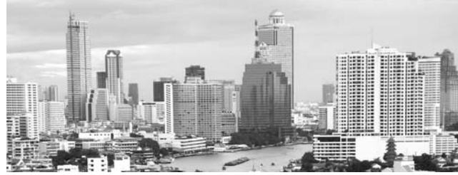
Bangkok, die 12-Millionen-Metropole am Chao Phraya

Thailand ist als Land des Lächelns weltbekannt. Aber nicht minder geschätzt ist die unglaublich vielseitige Thaiküche. Von schimmernden Tempeln mit goldenen Buddha-Statuen, über das quirlige Treiben in der Hauptstadt Bangkok, eine der weltoffensten Metropolen Asiens, bis hin zur üppigen tropischen Natur bietet Thailand weit mehr als traumhafte Strände. Die Reise führt in sehr verschiedene Regionen: in den vom Tourismus nur wenig berührten Isan, in das kulturelle und wirtschaftliche Zentrum Bangkok, in das Bergland des Nordens und zu atemraubenden Karstlandschaften im Süden.