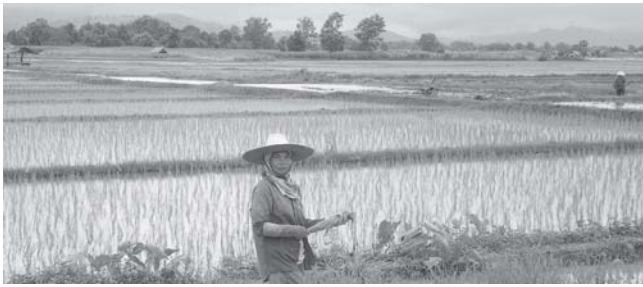
Reisfelder in Nordthailand