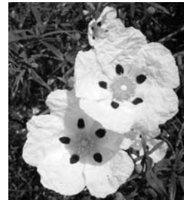
Blüten der Lackzistrose

Die letzten Tage der Reise verbringen wir in der spanischen Hauptstadt Madrid. Neben einem ausführlichen Besichtigungsprogramm wird auch dort genügend Zeit für individuelle Pläne und eigene Entdeckungen bleiben.