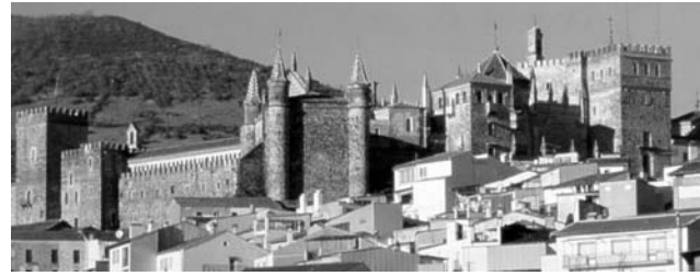
Königliches Kloster Nuestra Señora de Guadalupe (UNESCO-Weltkulturgut)

Nach der Anmeldung zu dieser Exkursion wird mit der von GEOPULS zugesandten Buchungsbestätigung eine Anzahlung (15 % des Reisepreises) fällig. Die Restzahlung erfolgt zwei Wochen vor Reisebeginn. Es gelten die Geschäftsbedingungen des Veranstalters: Geopuls-Studienreisen, Neckarhalde 62, 72108 Rottenburg a.N. (Tel. 07472-9808802). Die Allgemeinen Reisebedingungen werden gerne vorab zugeschickt. Sie können bei der VHS eingesehen, oder auch von der Homepage www.geopuls.de ausgedruckt werden.