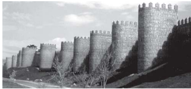
oben: Stadtmauer von Avila, unten: El Escorial