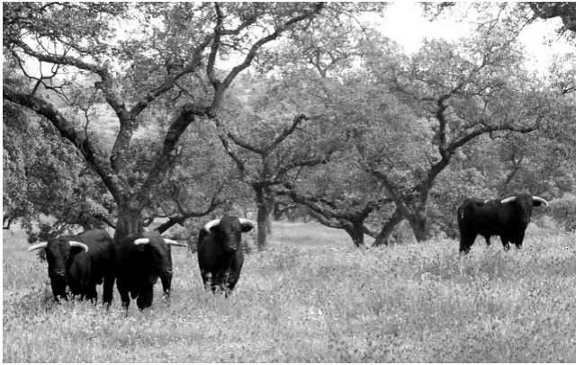
Szenerie in der Extremadura