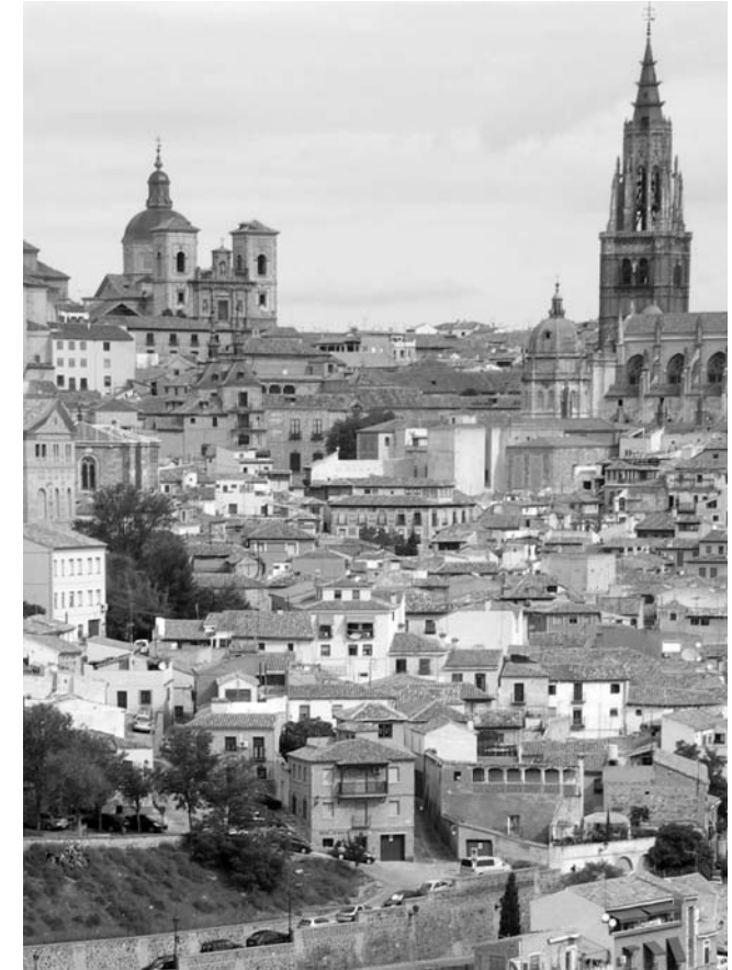
Altstadt von Toledo (UNESCO-Welterbe)