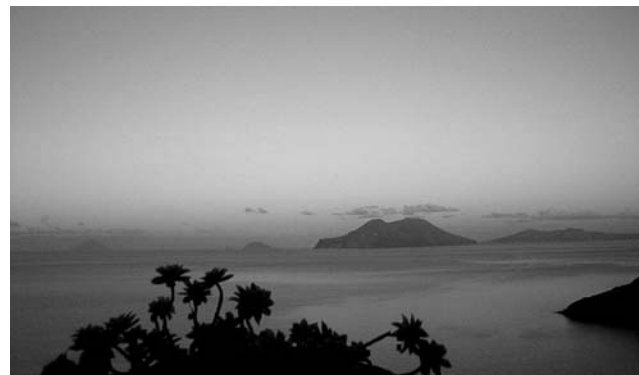
Abendstimmung: Blick vom Hotel auf Filicudi zu den anderen Äolischen Inseln

Nach vier Übernachtungen auf Filicudi geht die Reise mit dem Tragflügelboot weiter über die Inseln Salina, Lipari und Vulcano bis zur letzten Station: Taormina an der schönen Ostküste Siziliens. Im historischen Zentrum der 'Perle Siziliens' nehmen wir Quartier und starten von dort Tagesausflüge, u.a. auf den Ätna, mit einer kleinen vulkanologischen Wanderung, und nach Syrakus, mit seinen einmaligen Monumenten aus griechischer Vergangenheit.