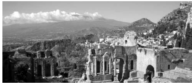
Blick vom Teatro Greco in Taormina zum schneebedeckten Ätna-Gipfel