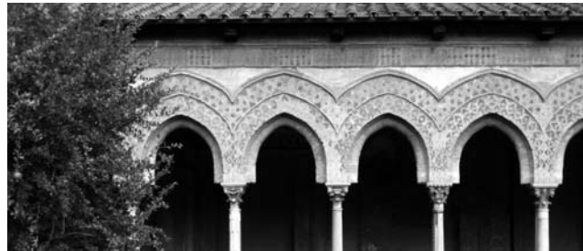
Detail im Kreuzgang von Monreale

GEOPULS wurde im Jahr 2004 von Tübinger Geographie-Dozenten gegründet, mit dem Ziel, länderkundliche Exkursionen interessierten, reisefreudigen Menschen außerhalb der Universität anzubieten und beliebte Reiseziele einmal anders zu erleben. Dabei geht es keineswegs akademisch zu, sondern mit Geographen unterwegs zu sein bedeutet Menschen, Kultur, Kunst und Geschichte fremder Länder und Regionen mit Blick hinter die Kulissen kennen zu lernen. Die Landesnatur nimmt dabei breiten Raum ein. Bei allen Zielen stehen deshalb auch immer Themen zu Geologie, Klima, Vegetation und Landschaft auf dem Programm. Ausflüge und kleine Wanderungen in die Natur führen im Wechsel mit dem Kulturprogramm erst zu einem ganzheitlichen Erleben und Genießen. Dabei reisen Sie von Anfang an in einer kleinen, gemütlichen Gruppe Gleichgesinnter, persönlich geführt von einem landeskundigen Geographen. Das alles zum fairen Komplettpreis und ohne fakultative Zwänge. Geopuls arbeitet dabei von Anfang an eng mit verschiedenen Volkshochschulen in der Region zusammen.