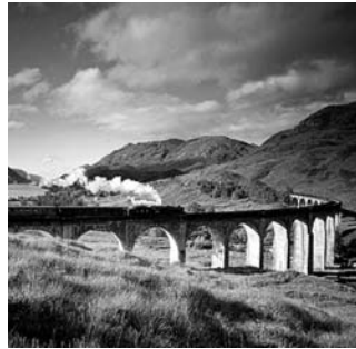
Viadukt West Highland Railway