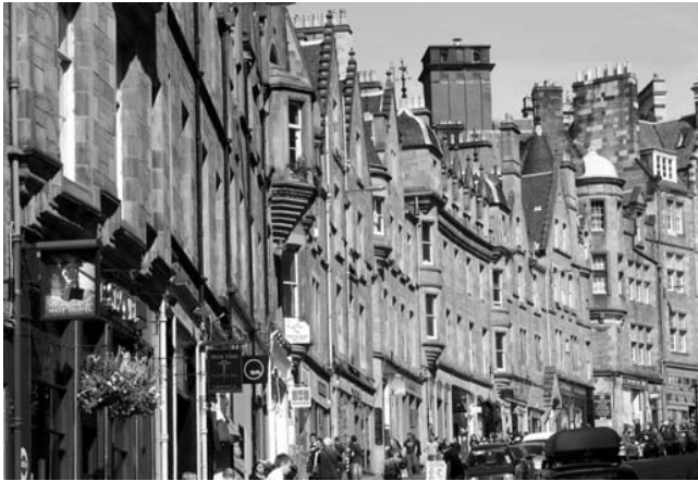
Edinburgh, Cockburn Street