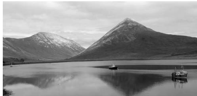
Landschaftszone auf der Isle of Skye

Am Anfang dieser erlebnisreichen Reise steht eine Stippvisite in Glasgow, dem modernen Herzstück Schottlands, das aus verfallener Altindustrie zur europäischen Kulturmetropole aufstieg. Ab Tag zwei, mit Basis auf der Isle of Skye, dann Schottland pur: im schottischen Nordwesten begegnen wir einer einmaligen Natur- und Kulturlandschaft. Wildromantische Lochs, majestätische Berge und malerische Burgen sind nur die bekanntesten Aspekte dieses Landes. Ausgangspunkt unserer Exkursion ist der idyllische Küstenort Portree auf der Isle of Skye (Innere Hebriden). Von hier aus erkunden wir diese urwüchsige Insel und die nahe gelegene Festlandküste Schottlands auf Ausflügen mit dem Bus, mit dem Schiff, zu Fuß (auf mehreren, gut zu bewältigenden Wanderungen) und mit der legendären West Highland Railway auf der „schönsten Zugfahrt Großbritanniens“. Zu entdecken gibt es eine Landschaft voller Geschichten: Die geologischen Spuren der Eiszeiten und die menschlicher Eingriffe, Küsten mit üppiger, fast mediterraner Vegetation, kulturelle Zeugnisse des Freiheitskampfes eines stolzen Volkes und der modernen Entwicklungsprobleme einer am äußersten Rand Europas gelegenen Region. Zur Abrundung der Exkursion steht zum Schluß noch die stolze Hauptstadt Edinburgh auf dem Programm.