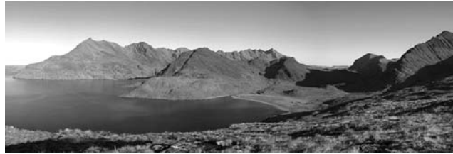
Cuillin Hills Loch Scaivaig, Isle of Skye

GEOPULS wurde im Jahr 2004 von Tübinger Geographie-Dozenten gegründet, mit dem Ziel, länderkundliche Exkursionen interessierten, reiseleidigen Menschen außerhalb der Universität anzubieten und beliebte Reiseziele einmal anders zu erleben. Dabei geht es keineswegs akademisch zu, sondern mit Geographen unterwegs zu sein bedeutet Menschen, Kultur, Kunst und Geschichte fremder Länder und Regionen mit Blick hinter die Kulissen kennen zu lernen. Die Landesnatur nimmt dabei breiten Raum ein. Bei allen Zielen stehen deshalb auch immer Themen zu Geologie, Klima, Vegetation und Landschaft auf dem Programm. Ausflüge und kleine Wanderungen in die Natur führen im Wechsel mit dem Kulturprogramm erst zu einem ganzheitlichen Erleben und Genießen. Dabei reisen Sie von Anfang an in einer kleinen, gemütlichen Gruppe Gleichgesinnter, persönlich geführt von einem landeskundigen Geographen. Das alles zum fairen Komplettpreis und ohne fakultative Zwänge. Geopuls arbeitet dabei von Anfang an eng mit verschiedenen Volkshochschulen in der Region zusammen.