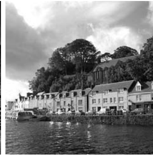
Portree, Isle of Skye