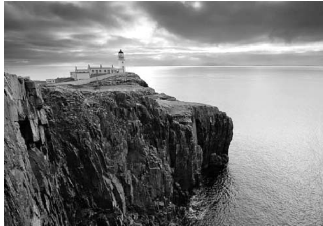
Neist Point Lighthouse, Isle of Skye